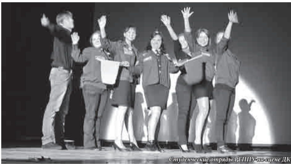
Студенческие отряды РГППУ на сцене ДК