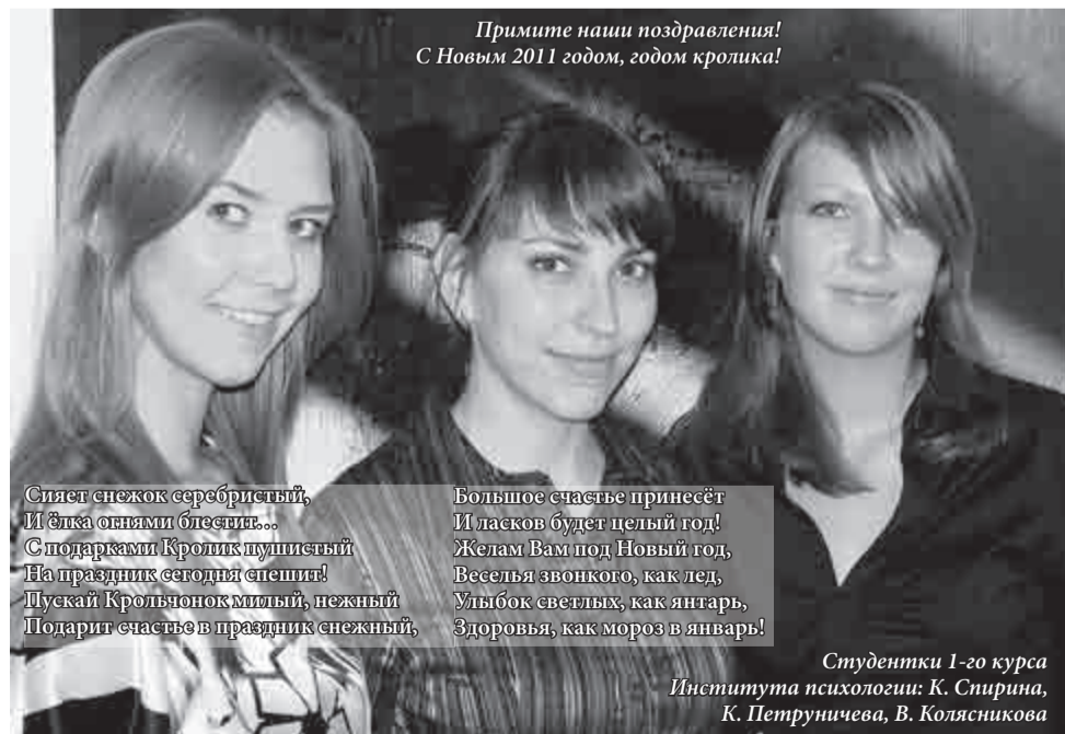
Примите наши поздравления! С Новым 2011 годом, годом кролика!

Сияет снежок серебристый, И ёлка огнями блестя... С подарками Кролик пушистый На праздник сегодня спешит! Пускай Крольчонок милый, нежный Подарит счастье в праздник снежный,