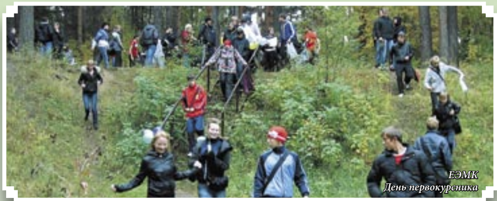
ЕЭМК День первокурсника