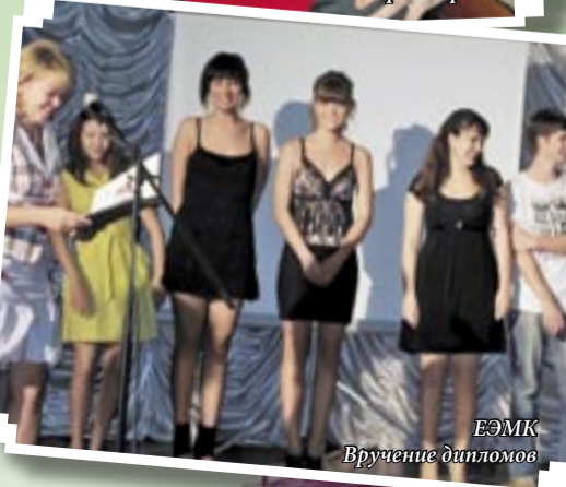
ЕЭМК Вручение дипломов