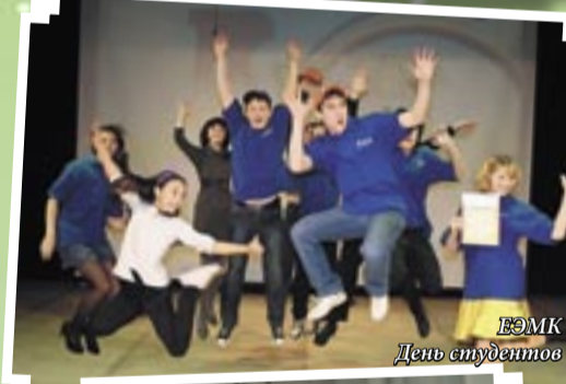
ЕЭМК День студентов