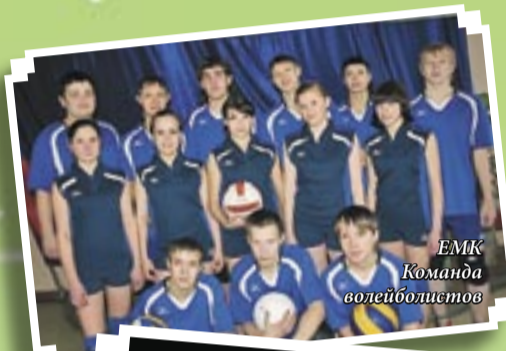
ЕМК Команда волейболистов

Спросите любого студента и выпускника Екатеринбургского машиностроительного колледжа РГПУ (ЕМК): «Как вы живете в колледже? Что можете вспомнить из своей студенческой жизни?» Вам ответят, что учиться было сложно, но в то же время было весело и интересно. Ведь колледж – это особый мир: ещё не вуз, но уже и не школа. И это особое положение накладывает отпечаток на всю студенческую жизнь наших учащихся.