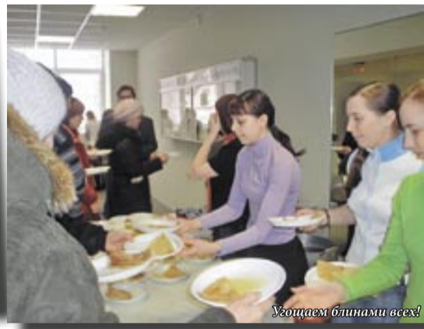
Угощаем блинами всех!