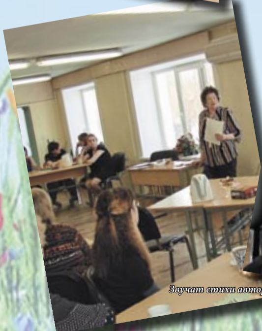
Звучат стихи автора