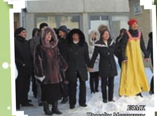
ЕЭМК Проводы Масленицы

Все, кто к нам приходит учиться, – очень довольны! Впоследствии многие из выпускников приводят сюда своих детей и внуков. Вот так!