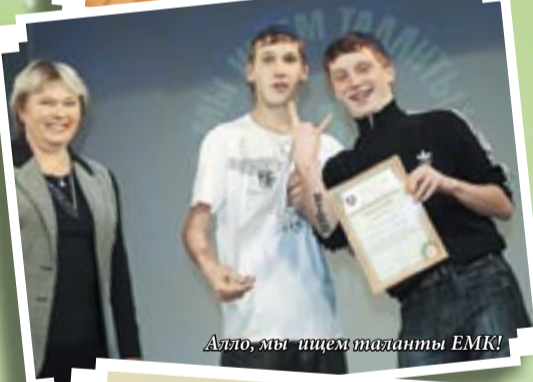
Алло, мы ищем таланты ЕМК!