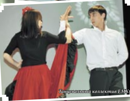
Танцевальный коллектив ЕМК