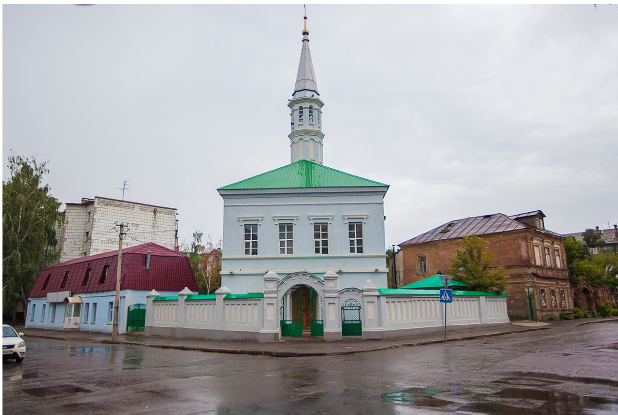
Рис. 5. Голубая мечеть