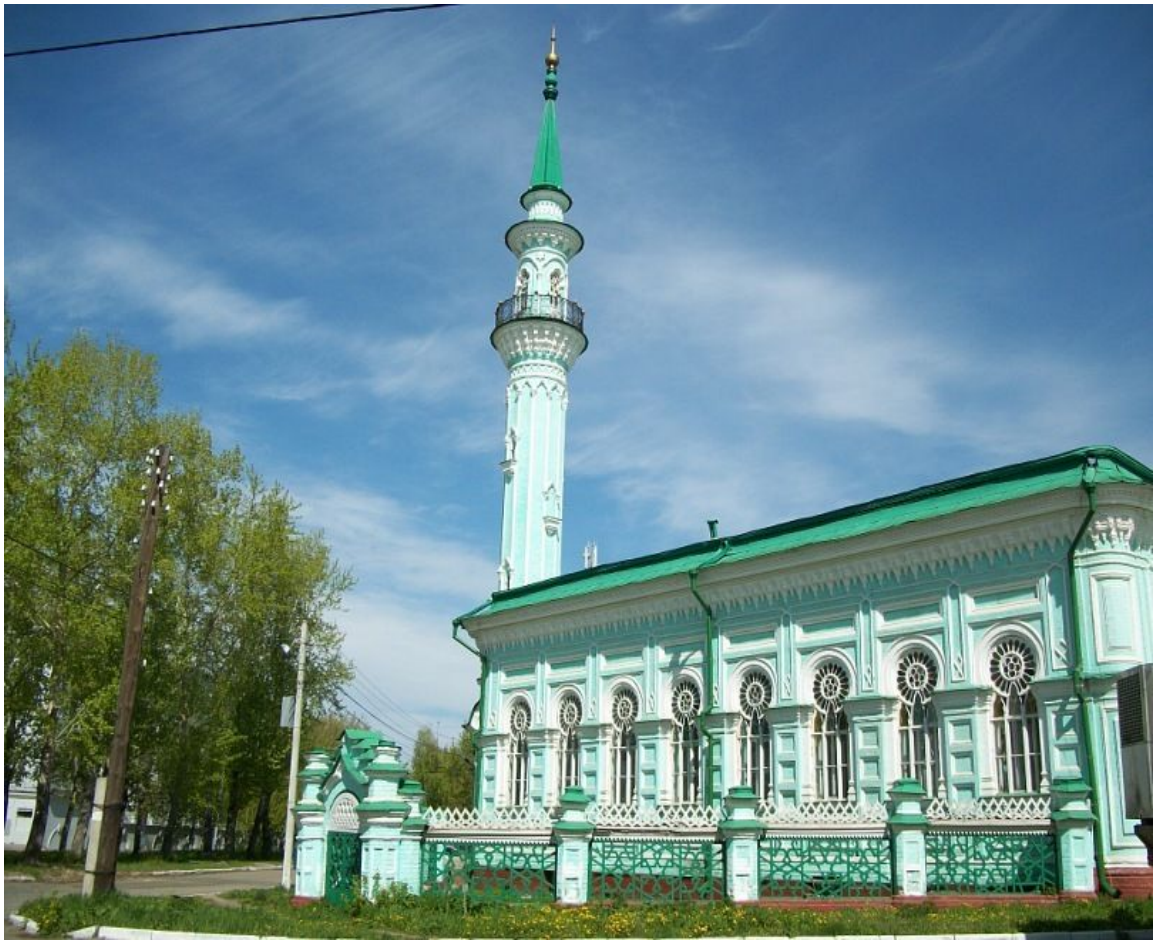
Рис. 9. Азимовская мечеть