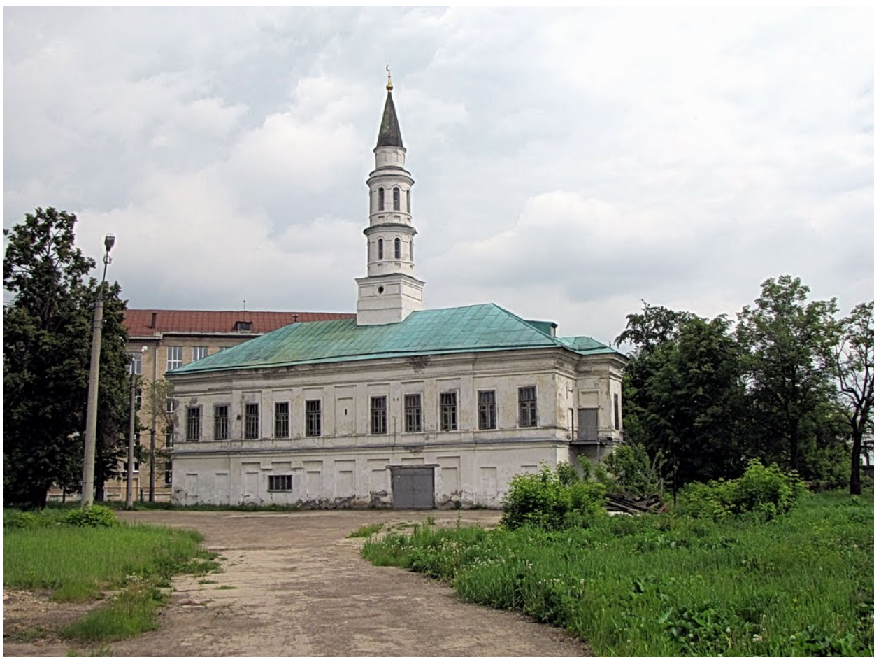
Рис. 11. Мечеть Иске Таш