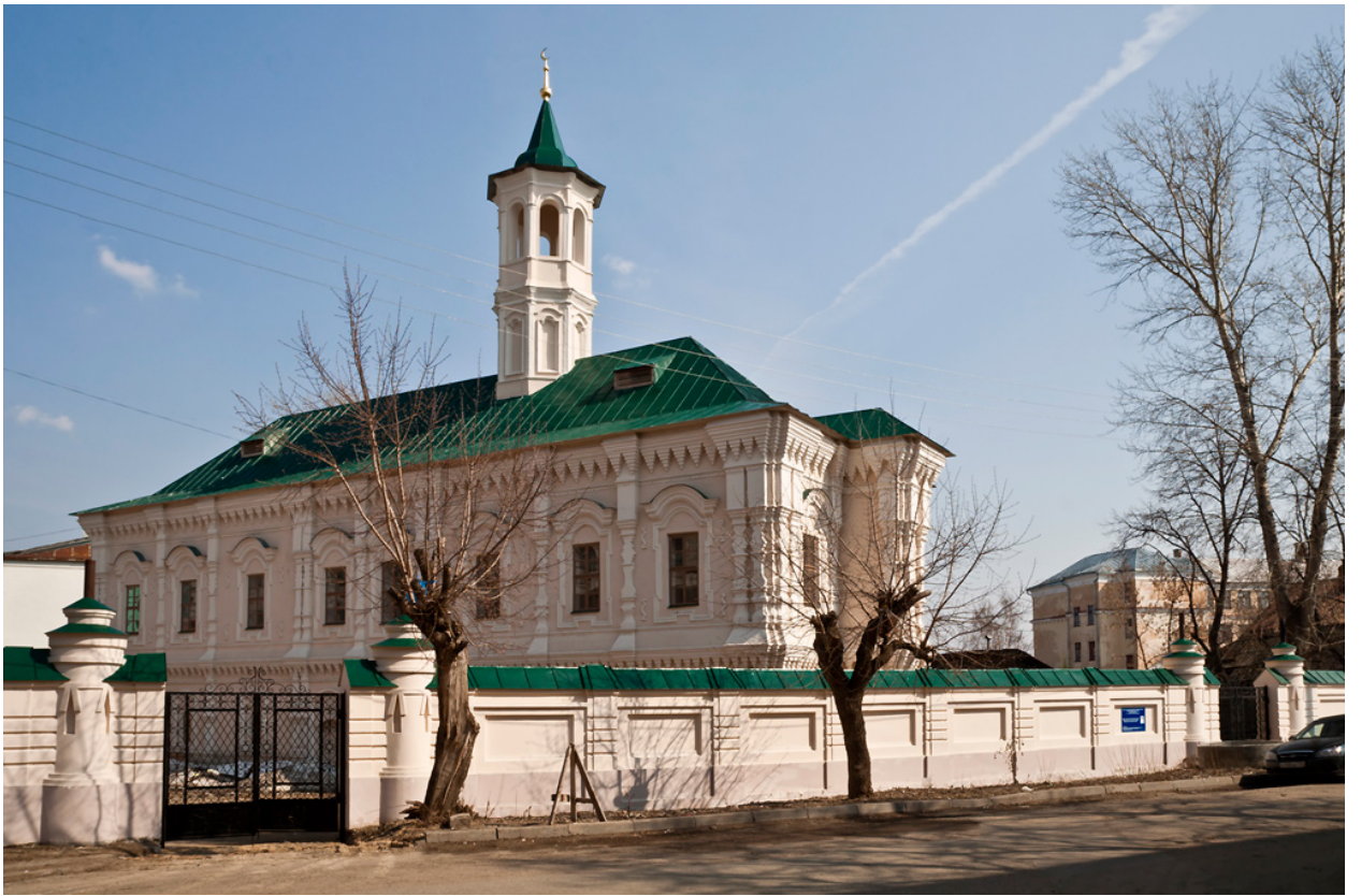
Рис. 6. Апаевская мечеть