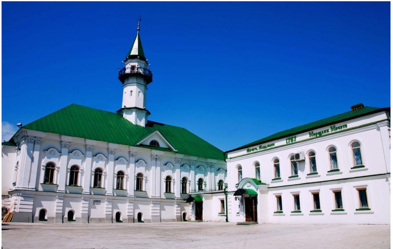
Рис. 4. Мечеть аль-Марджани