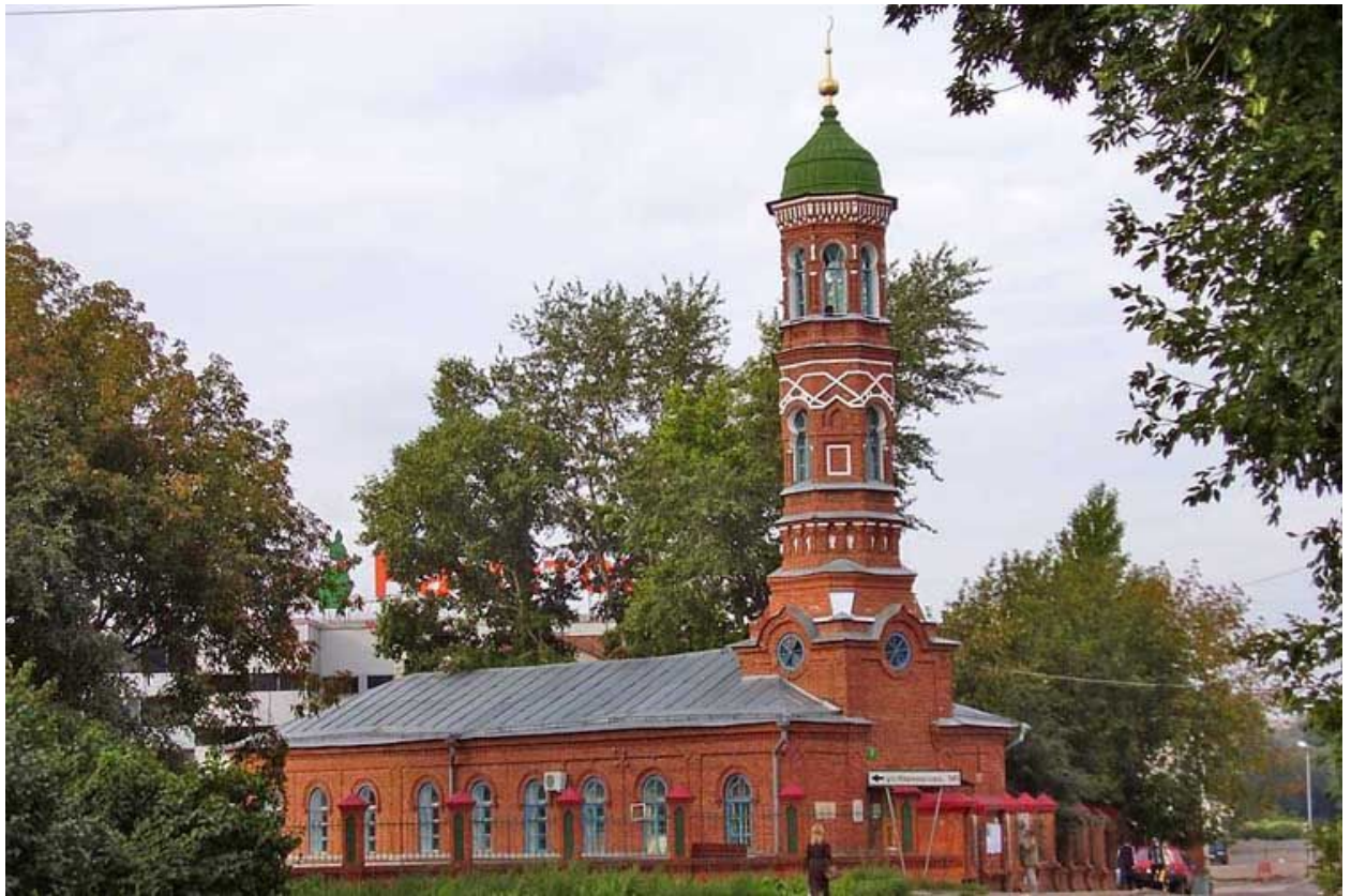
Рис. 8. Бурнаевская мечеть