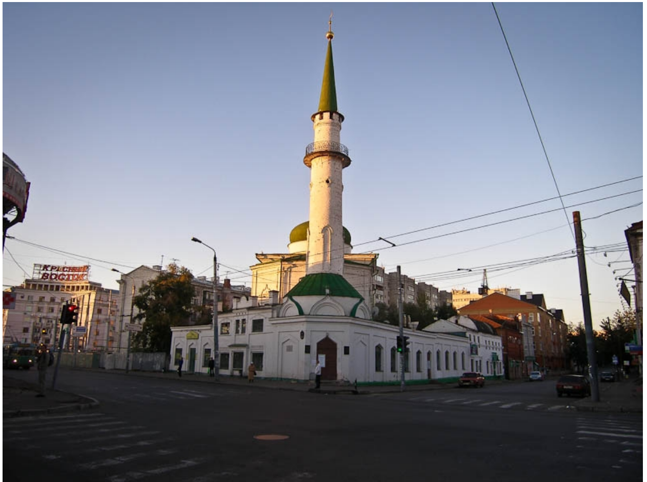
Рис. 3. Мечеть Нурулла