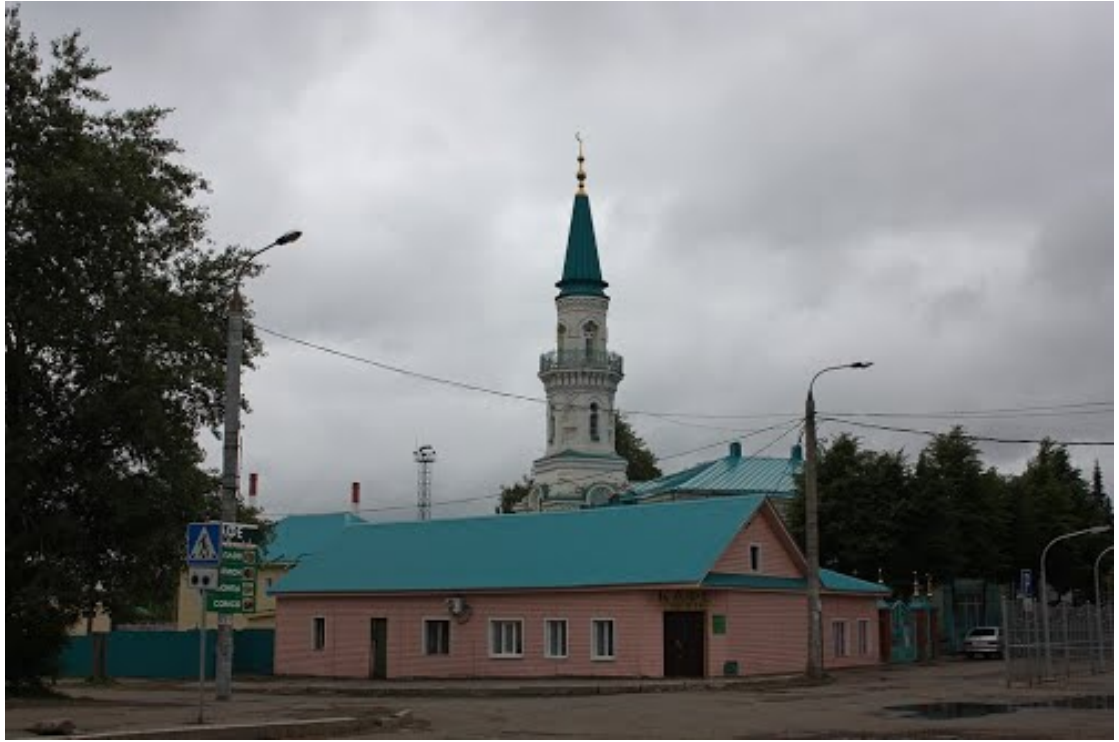
Рис. 10. Розовая мечеть