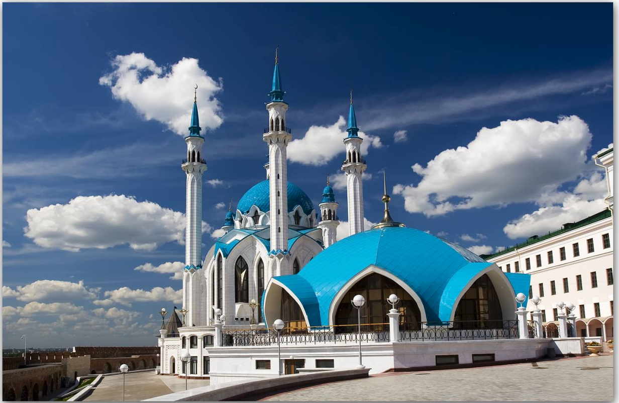
Рис. 1. Мечеть Кул Шариф