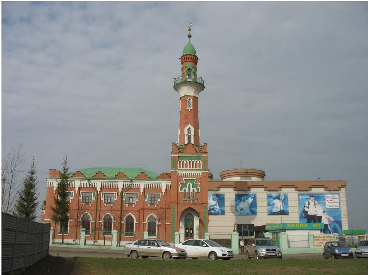
Рис. 7. Мечеть 1000-летия Принятия Ислама