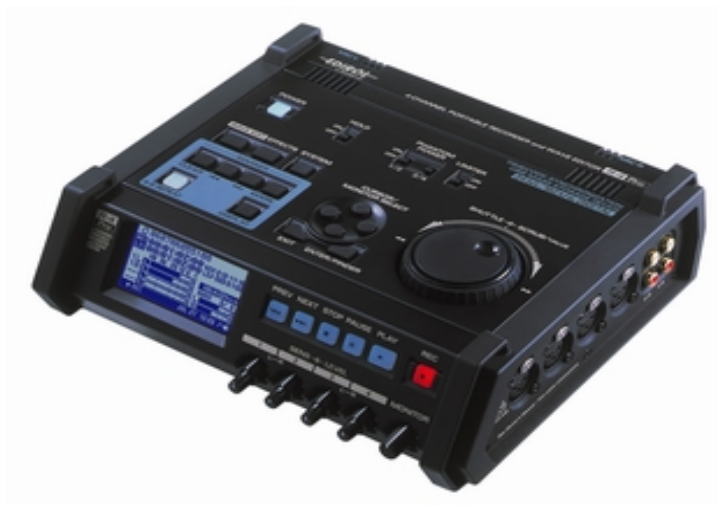
Рисунок 1 –4x-канальное устройство аудиозаписи EDIROL R-4.

Прочная конструкция, набор надёжных функциональных возможностей и великолепное качество звука. Запись до четырех каналов в режиме 24 бита 96 кГц и монитор каждого канала в отдельности. Прочное гнездо для подключения питания предоставляет возможность подключения батарейных блоков промышленного стандарта для увеличения времени записи. 40 Гб жесткий диск способен сохранить до 58 часов высококачественного аудио.