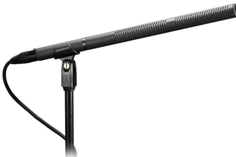
Рисунок 5–Конденсаторный микрофон-пушка Audio-Technica AT835B.

Audio-technica AT835B – конденсаторный микрофон, разработанный для профессиональной записи. Применяется в радиовещании и записи фильмов/телевидения/видео. Имеет узкий приемный угол. Переключаемый уровень низкой частоты. Работает от фантома или батареи.