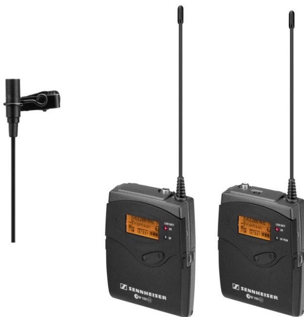
Рисунок 3 –Комплект радиосистем SennheiserEW 100 ENGG2.

Радиосистемы Sennheiser идеально подходит для записи звука на видеосъемках и озвучивания театральных представлений и презентаций, для внестудийной работы в области телевидения, репортажа и сбора новостей. Миниатюрный микрофон практически невидим при съемках.