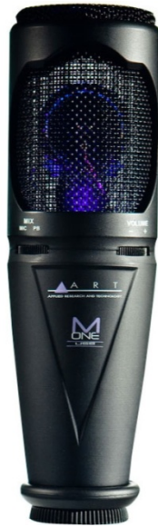
Рисунок 6–Студийный конденсаторный микрофон ARTMONE.