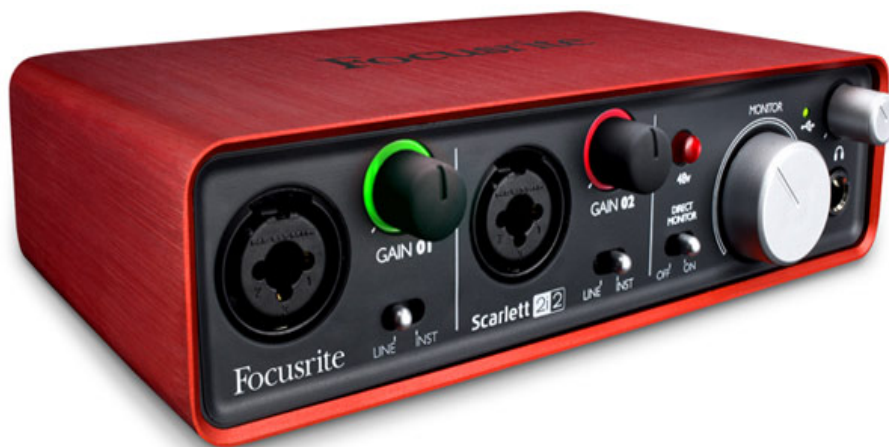
Рисунок 8 – звуковая карта Focusrite Scarlett 2i2.