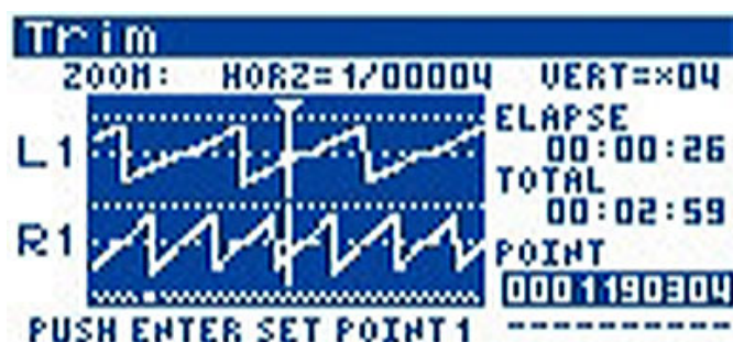
Рисунок 2 – Дисплей рекордера EDIROLR-4 в режиме редактирования Wave-волны.

Шина USB 2.0 обеспечивает высокоскоростной обмен данными с компьютером. Вы можете передавать данные примерно в 20 раз быстрее чем DAT магнитофон. Вы также можете использовать R-4 в качестве 40ГБ запоминающего устройства. Редактирование файлов R-4 можно осуществлять напрямую с рабочей станции для цифровой обработки звука а также другими приложениями.