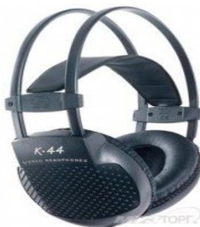
Рисунок 4 –Мониторные наушники AKGK-44.