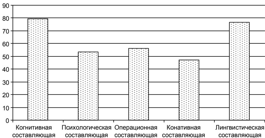
Рис. 3. Готовность представителей ППС к использованию СОР (средние показатели по ЭГ-2), %

связано с тем, что у значительной части преподавателей нет не только педагогического, но и гуманитарного образования и они не осознают важности проектирования учебно-педагогического взаимодействия. Многие преподаватели, особенно технических специальностей, полагают, что им достаточно быть грамотными лишь в предметной области. Изменить такое положение возможно, предоставив педагогам больше информации о преимуществах СОР (когнитивная составляющая готовности) и сформировав у них потребность в применении технологий (психологическая составляющая готовности), что послужит платформой для обретения соответствующих компетенций и осмысленного практического приложения теоретических знаний о СОР (операционная и конативная составляющие готовности). В совокупности перечисленные элементы готовности к использованию СОР составляют ориентировочную основу для измерения профессионализма педагогов высшей школы.