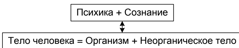
Рис.1. Структура тела общественного человека

Первая, исходная, основа – производство орудий с помощью орудий. Тело человека включает в свой состав органическое тело и тело неорганическое , функционально-предметное. С появлением неорганической внешней надставки над органическим телом возникает одновременно и « внутренняя надставка » в сфере психики – сознание. Психика обслуживает функционирование органического тела. Сознание появляется как технологически необходимый регулятивный фактор, который направляет функционирование неорганического тела. Это тело может функционировать при условии, если оно представлено в сознании системой значений . Представим это схематично (рис.1):