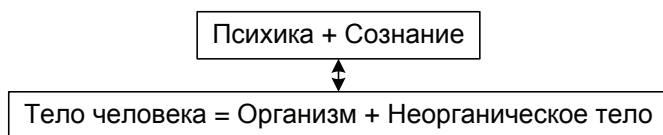
Рис. 1. Структура тела общественного человека

Первая, исходная, основа универсальности — наличие у человека неорганического тела . Тело человека включает в свой состав органическое тело и тело неорганическое , функционально-предметное. С появлением неорганической внешней надставки над органическим телом возникает одновременно и « внутренняя надставка » в сфере психики — сознание. Психика обслуживает функционирование органического тела. Сознание появляется как технологически необходимый регулятивный фактор, который направляет функционирование неорганического тела. Это тело может функционировать при условии, если оно представлено в сознании системой значений . Представим это схематично (рис. 1):