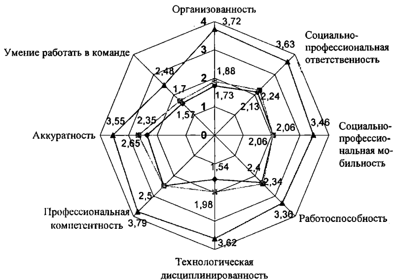
Рис. 2. Сравнение профилей по уровню развития метапрофессиональных качеств испытуемого, полученных в разных измерениях:

◆ — измерение 1; ■ — измерение 2; ▲ — измерение 3