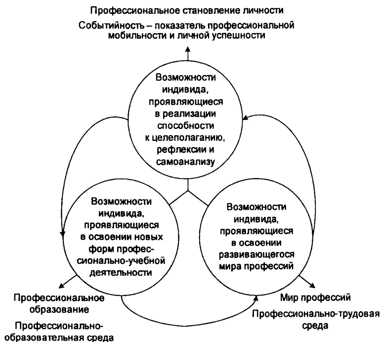
Рис. 2. Модель формирования и области проявления динамической профессиональности специалиста в структуре профессионально-образовательного пространства

На рис. 2 представлена модель формирования и области проявления динамической профессиональности специалиста в структуре профессионально-образовательного пространства.