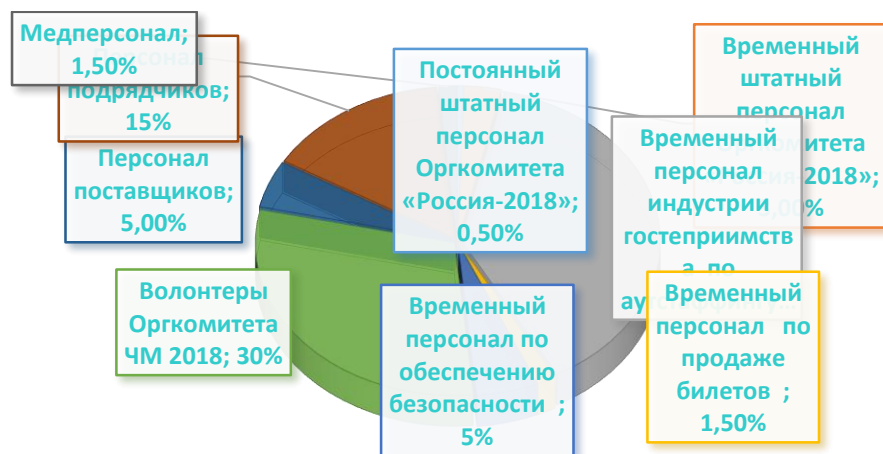
Рисунок 1 – Структура персонала ЧМ-2018, % к итогу

Эффективная работа персонала является ключевым фактором успеха подготовки и проведения ЧМ-2018. Персонал ЧМ-2018 состоит из 4-х категорий: постоянный и временный штатный персонал Оргкомитета «Россия-2018»; временный персонала по аутстаффингу; волонтеры Оргкомитета; персонал поставщиков и подрядчиков (рис.1).