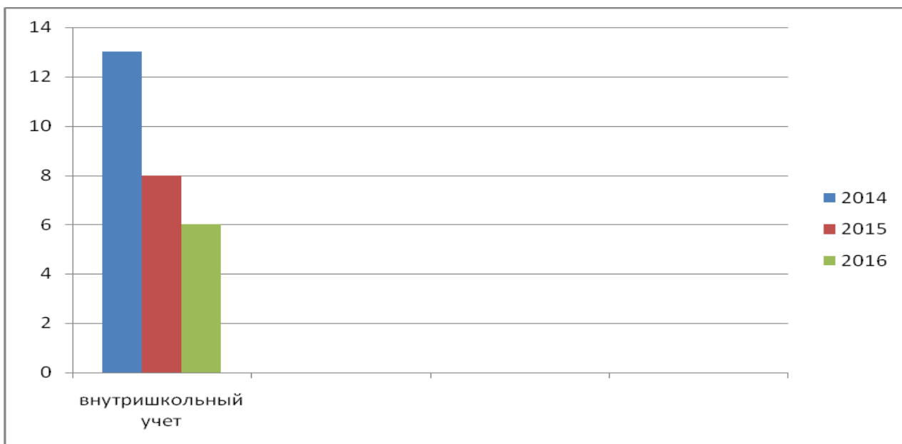
Рисунок 2. Количество учащихся МАОУ СОШ № 62 , состоящих на внутришкольном учете.

Исходя из данных за 2013 – 2016 годы, предоставленных в таблице 1 и таблице 2 (схематично на рисунке 1 и 2), можно проследить уменьшение количества учащихся, поставленных на внутришкольный учёт и учёт ОДНОП № 7. Это можно считать показателем тщательной работы по пресечению и профилактике правонарушений несовершеннолетних.