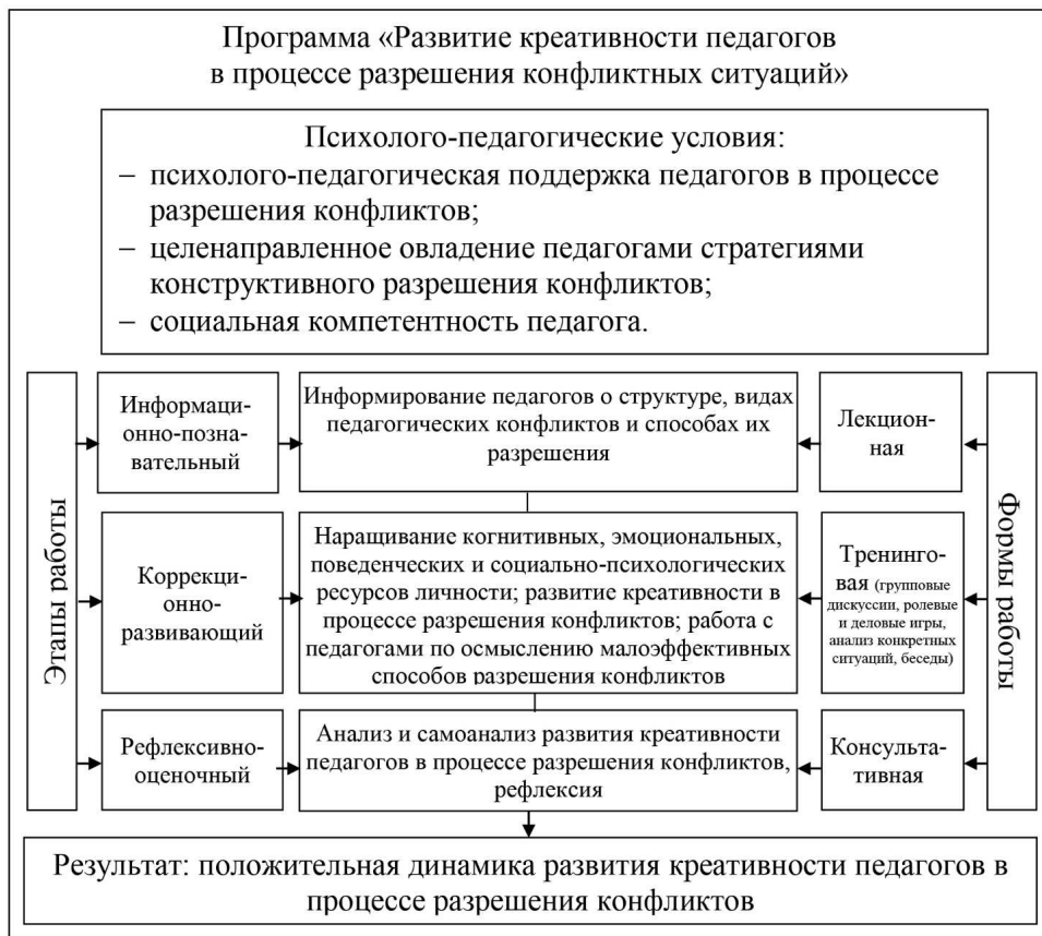
Рис. 2. Процесс реализации программы по развитию креативности педагогов в процессе разрешения конфликтов

После реализации программы было предпринято повторное измерение креативности педагогов по разрешению конфликтов. Повторная диагностика на оценочно-результативном этапе была осуществлялась посредством тех же методик, что и первичная. Результаты коррекционно-развивающего этапа эмпирического исследования развития креативности педагогов в процессе разрешения конфликтов размещены в табл. 1.