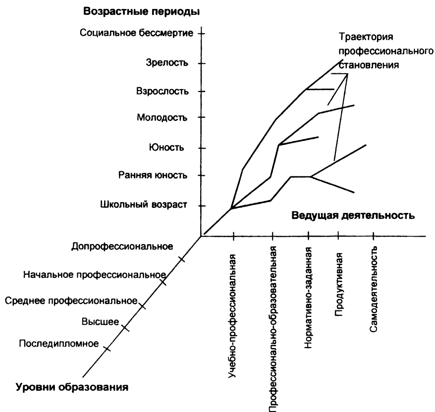
Рис. 2. Эвристическая модель профессионально-образовательного пространства

2. Профессионально-психологический потенциал как энергетическая характеристика личности обуславливает открытость и неравновесность профессионально-образовательного пространства, нелинейность и вариативность траектории профессионального становления личности.