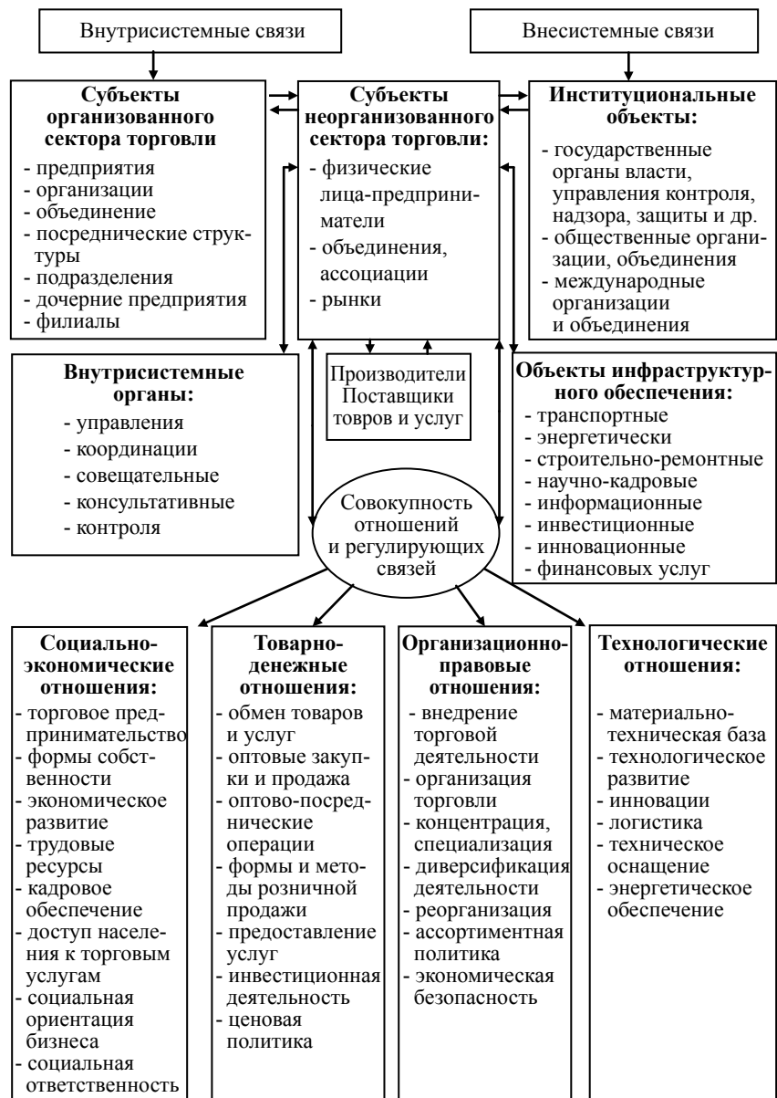
Рис. 1. Система отношений и связей неорганизованного сектора торговли