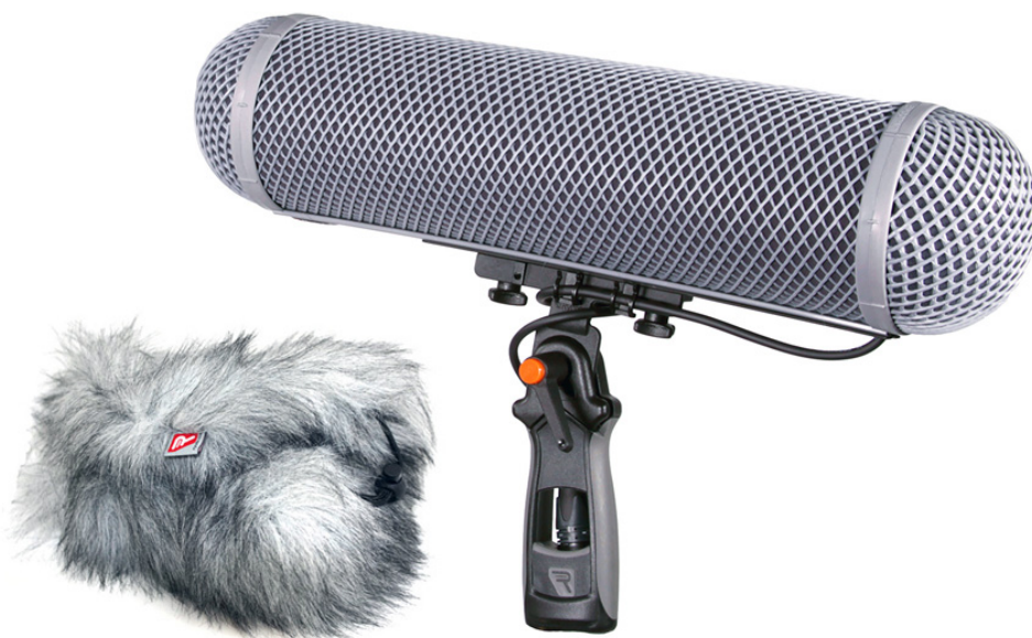
Рисунок 4 – Ветрозащита