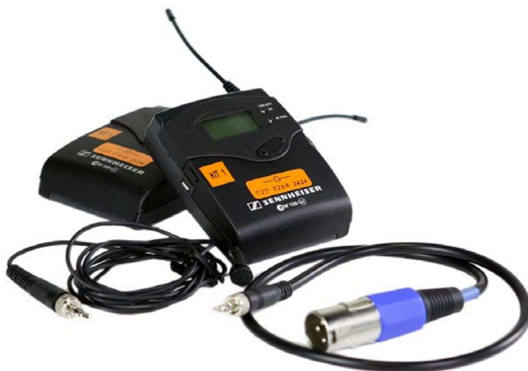
Рисунок 5 – Радиосистема Sennheiser ew 100-ENG G3

Наш комплект радиосистем Sennheiser ew 100-ENG G3 имел два петличных микрофона круговой направленности, два портативных передатчика SK 100 G3 и два портативных приемника EK 100 G3. И передатчики, и приемники оснащены графическими дисплеями и имеют металлические корпуса. Приемники оснащены системой Adaptive Diversity для надёжного приёма сигнала. Система имеет пресетный эквалайзер и функцию Soundcheck для контроля условий приёма сигнала. К системе подходят батарейки типа АА в количестве 6 штук для портативной аудиозаписи. В процессе наших съёмок радиосистема крайне хорошо показала себя в работе при морозе на улице, как в плане записи, так и в плане сохранения батареи.