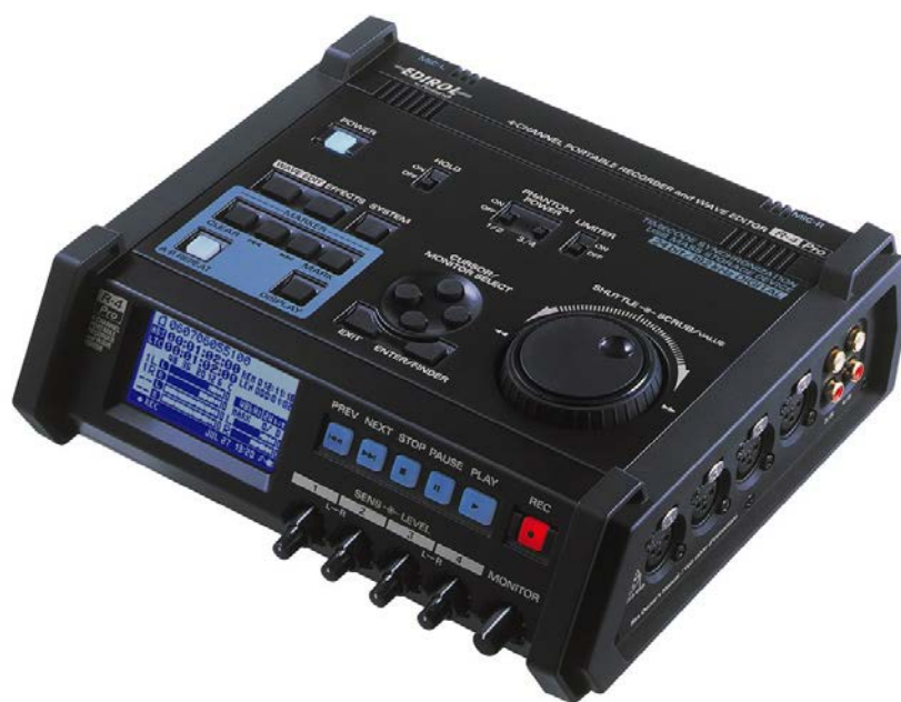
Рисунок 1 – EDIROL R-4PRO

резервное копирование проектов и файлов. К тому же, EDIROL R-4 PRO имеет бортовые эффекты, функции WAV редактирования и фильтры входных частот. Так, лимитер встроенный в аналоговый каскад, помогает обеспечить устойчивую и надежную запись, свободную от шума и внезапных входных перегрузок. 4 комбинированных разъема XLR/Phone имеют функцию фантомного питания и предоставляют возможность выбора МОНО, СТЕРЕО, СТЕРЕОx2 или одновременной 4-канальной записи.