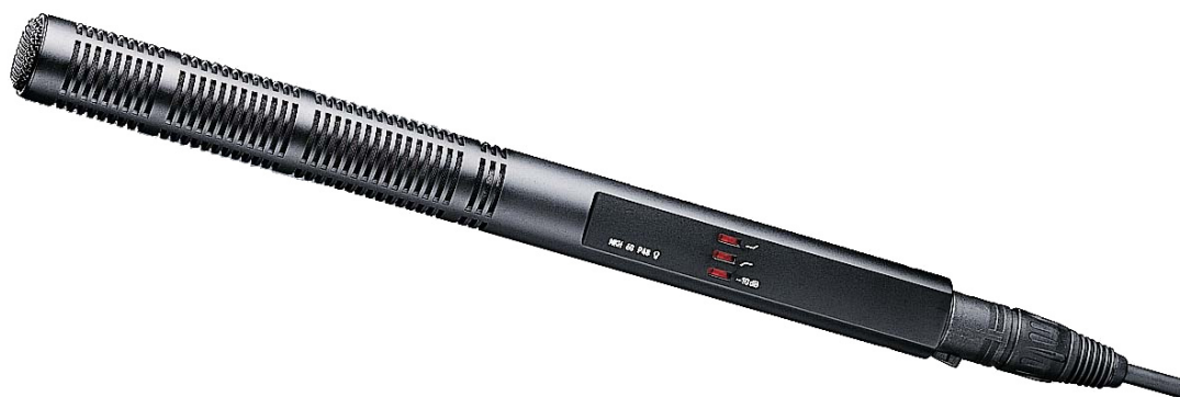
Рисунок 2 – Микрофон «пушка» Sennheiser МКН-60

Также вместе с микрофоном использовалась идущая в комплектации ветрозащита. Она была необходима для того, чтобы поток воздуха, во время съемок на улице, не разбивался о твердые края входного отверстия и не создавал воздушные вихри.