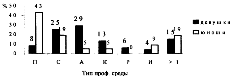
Рис. 3. Показатели по типам профессиональной среды отдельно для юношей и девушек

Результаты исследования по половому признаку представлены на рис. 3.