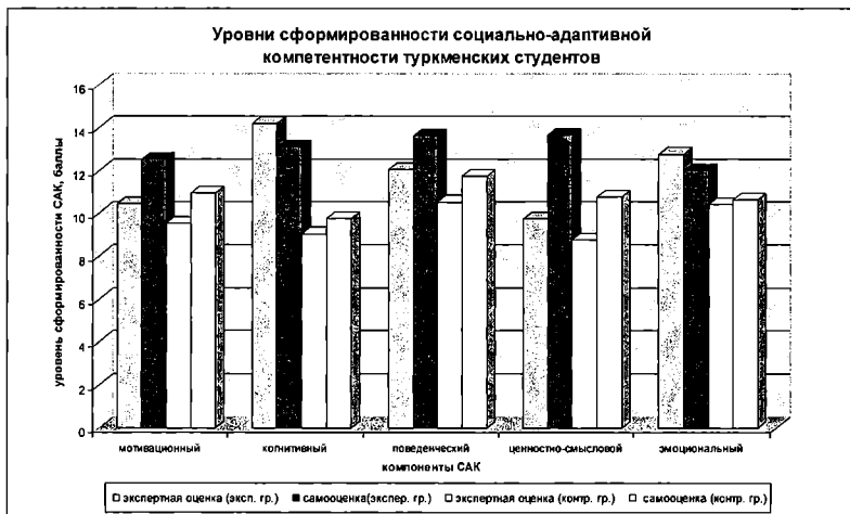
Рис. 2 Уровни сформированности социально-адаптивной компетентности туркменских студентов

До и после окончания эксперимента (в конце семестра) экспериментальные группы были протестированы посредством опросника Л.В. Янковского. Предварительно была установлена взаимосвязь между компонентами САК и шкалами опросника Л.В. Янковского. Количественные показатели теста измерялись следующим образом: низкий уровень – менее 6 баллов; средний – от 6 до 12 баллов; высокий – более 12 баллов.