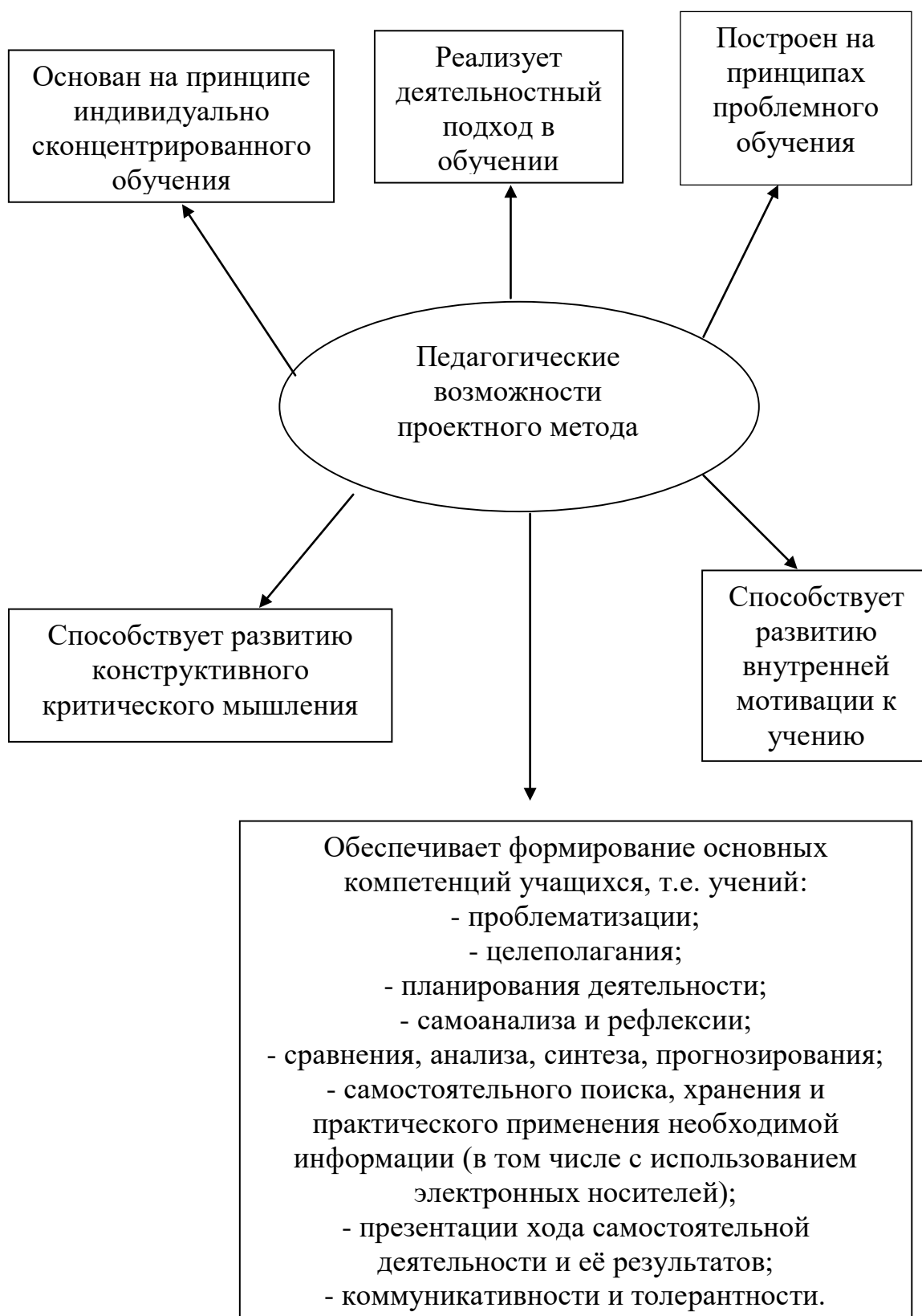
Рис. 1. Педагогическая эффективность метода проектов