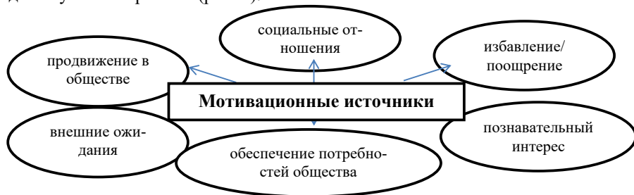
Рис. 2. Мотивационные источники для обучения взрослых

1. Мотивация образовательной деятельности взрослых обучающихся, определяемая особенностями профессиональной деятельности, социальным окружением и требованиям государственных образовательных стандартов. Взрослые люди после получения обязательного образования повсеместно сталкиваются с образовательной деятельностью, поэтому необходимость изучения мотивационной сферы личности обучающегося занимает важное место в проблематике дополнительного образования [1]. Для решения данной проблемы предполагается использование андрагогической модели организации образовательной деятельности взрослых обучающихся. Особенный интерес представляют мотивационные источники для обучения взрослых (рис. 2).