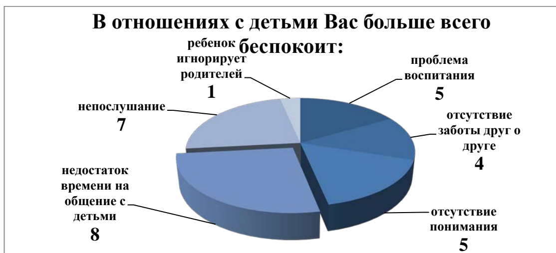
Рисунок 2. Специфика возникающих затруднений в детско-родительских взаимоотношениях.

В отношениях с детьми родителей волнует недостаток времени (у 8 человек), непослушание детей (7 чел.), отсутствие понимания и проблему воспитания (5 чел), отсутствии взаимной заботы с детьми (4 чел) и лишь 1 респондент отметил существенность игнорирования ребенком родителей во взаимоотношениях.