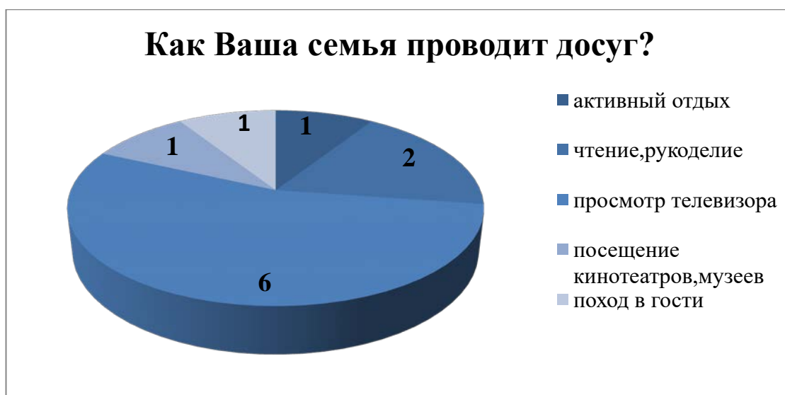
Рисунок 4. Организация семейного досуга.