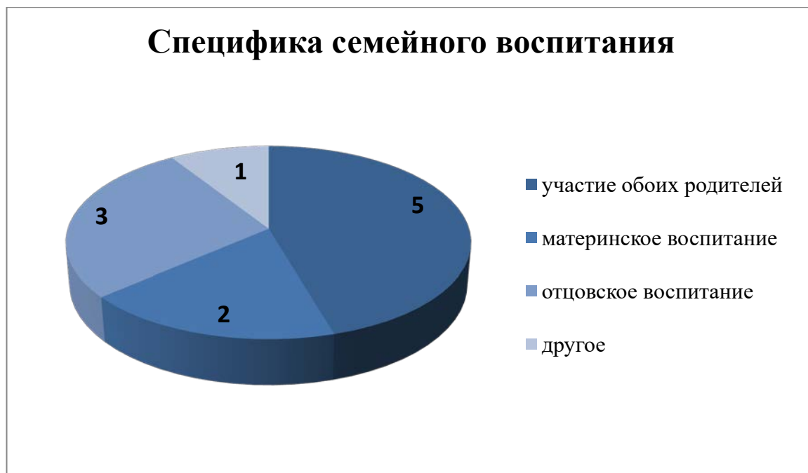
Рисунок 1. Специфика семейного воспитания в семье.

Следующими были данные, затрагивающие специфику семейного воспитания: