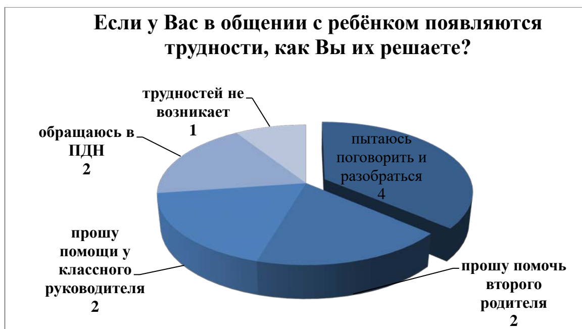
Рисунок 3. Способы разрешения трудностей во взаимоотношениях с ребенком.

Из проведенного анкетирования следует, что недостаток времени на общение с детьми является ключевым в детско - родительских взаимоотношениях. В связи с высокой занятостью родителей (отец большую часть времени тратит на работе, мать исполняет обязательства по хозяйству) уделить достаточное время воспитанию детей очень трудно. Нехватка времени, недостаточный уровень знаний по воспитанию детей создают определенную проблему в таких семьях. Недостаток внимания и воспитания влечет к тому, что ребенок вырастает неуверенной и закомплексованной личностью (рис.2).