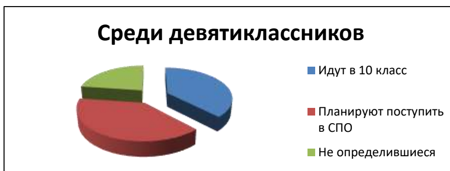
Рисунок 1. Готовность к профессиональному самоопределению девятиклассников

гают, что справились или справятся с выбором без посторонней помощи, собственными силами (рис.1).