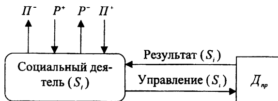
Рис. 1. Модель функционирования социального деятеля

Рассматривая в качестве субъекта деятельности ( S_i ) 1 гипотетического социального деятеля (рис. 1), можно утверждать, что его привлечение либо возникновение обусловлено необходимостью (точнее потребностью \Pi^- ) организации и осуществления (управление – Y_i ) совместной практической деятельности ( D_{np} ) с целью получения какого-то результата P_i (другими словами, есть потребность \Pi^- – создается либо привлекается S_i ).