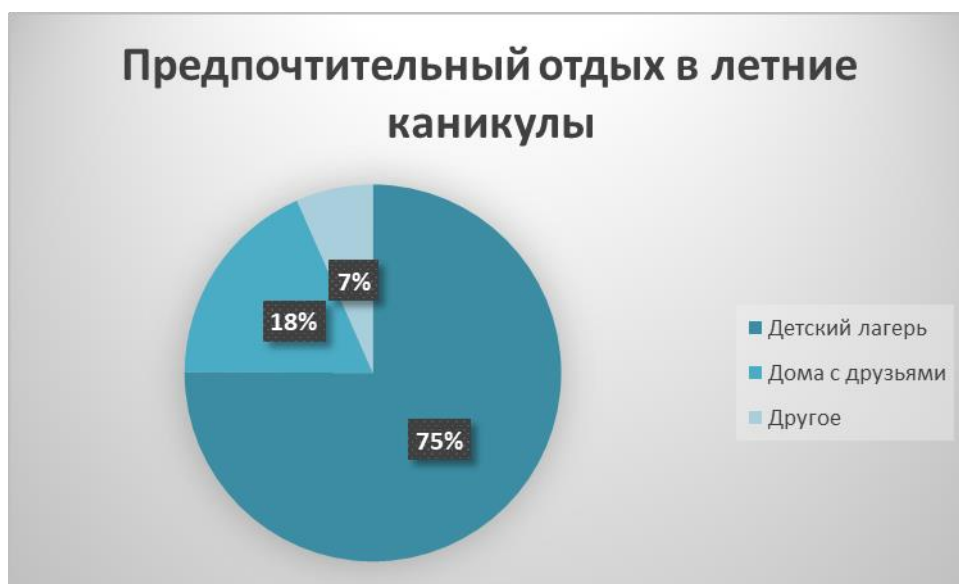
Рисунок 1. Предпочтительный отдых в летние каникулы

Из них в детском лагере провели 1 смену – 21,7%; 2-4 смены – 28,3%; 5-8 смен 41,7%, 9 и больше – 8,3%, что является отличным результатом для объективной оценки отдыха в ДОЛ и указывает на достаточно высокий уровень востребованности, так как из 60 респондентов 47 провели в лагере больше одной смены. Результат выбора наиболее предпочтительного вида досуга представлен на рисунке 1.