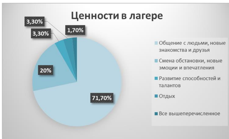
Рисунок 2. Выбор наиболее популярных ценностей в лагере

Результаты выбора наиболее популярных ценностей в лагере представлены на Рисунке 2.