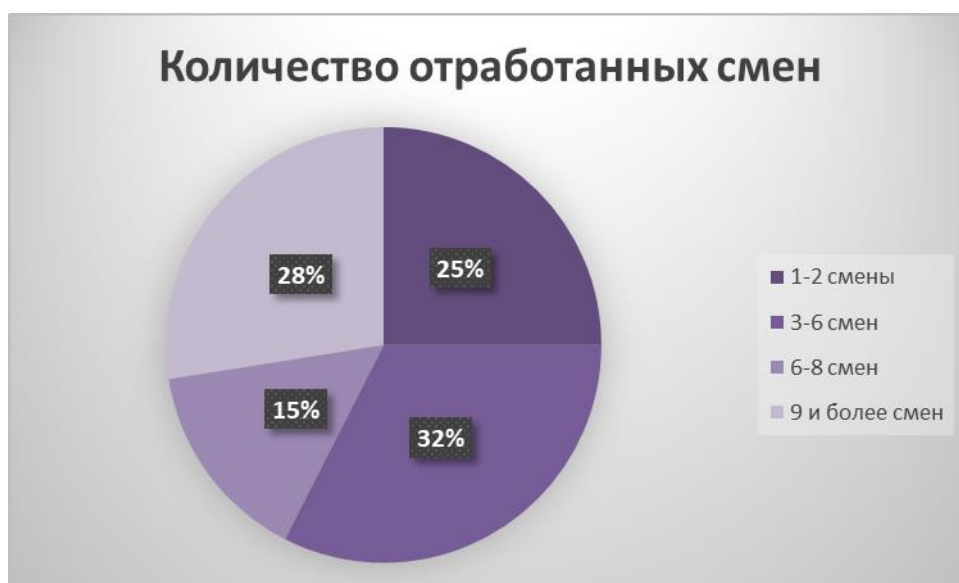
Рисунок 3. Количество отработанных респондентами смен

По данным результатам можно сделать вывод, что респонденты способны дать объективную оценку, так как имеют достаточный опыт, указывает на желание вожатых и воспитателей реализовывать организацию досуга с детьми в условия детского оздоровительного лагеря.