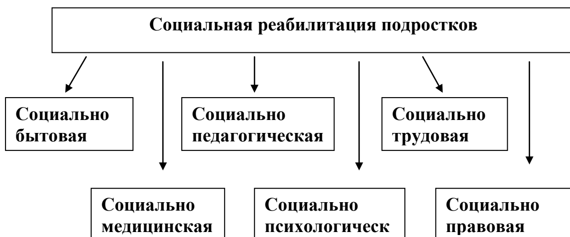
Рис. 1. Элементы социальной реабилитации подростков с девиантным поведением.

Социальная реабилитация включает: 1) реализацию программ и действий, направленных на реинтеграцию индивида в обществе или культурную систему; 2) комплекс медико-психолого-педагогических и социально-правовых мер, имеющих целью восстановление у него основных социальных функций личности, психического, физического и нравственного здоровья, социального статуса.» 1 Следовательно, под реабилитацией подростков следует понимать комплексный подход, направленный на самореализацию внутренних возможностей личности. Социальная реабилитация подростков в широком значении и включает в себя ряд элементов. Рассмотрим элементы социальной реабилитации на (Рис. 1).