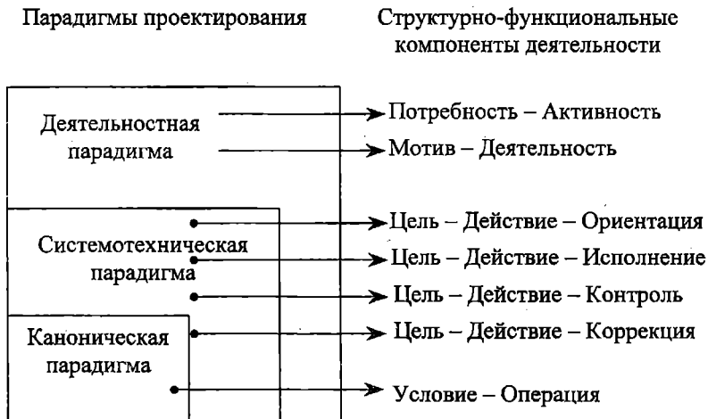
Рис. 1. Соотношение парадигм проектирования и функциональной структуры деятельности

Проектирование образовательного пространства субъекта, осуществляемое на основе деятельностной парадигмы, предполагает воссоздание на практике полной структуры деятельности, включающей: возникновение потребностного состояния, поиск предмета потребности (мотива), выявление целей и условий деятельности (рис. 1).