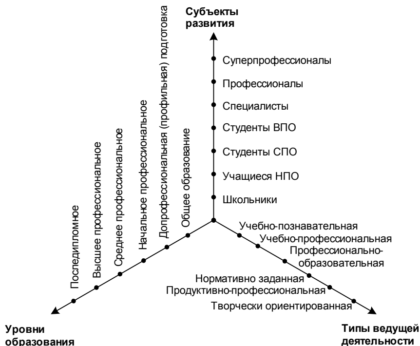
Рис. 1. Модель образовательного пространства

В качестве смыслообразующего понятия выступает развивающееся образовательное пространство – система психолого-педагогических уровней непрерывного образования, развивающихся видов деятельности и субъектов личного и профессионального развития (рис. 1). Эти структурные составляющие выступают в качестве координат-векторов, образующих прямоугольное (евклидово) пространство. Функционирование этих структурных составляющих в режиме взаимодействия образует открытое, воспроизводящееся и саморазвивающееся образовательное пространство.