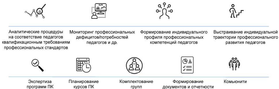
Рис. 2. Автоматизированные процессы в АИС «Кадры в образовании. Самарская область»

Благодаря автоматизации удалось устранить частично или полностью выше обозначенные проблемы (рис. 2).