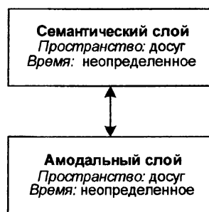
Рис. 1. Смысловое образование «досуг, развлечения» в самосознании женщин, не имеющих детей

Корреляционные связи отражают наличие следующих СО в смысловом содержании самосознания женщин первой группы: «досуг, развлечения», «дети». Представим обнаруженные СО схематично (рис. 1, 2).