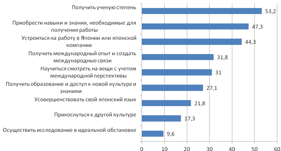
Рис. 3. Цели обучения иностранных студентов в Японии, % ответов респондентов (по результатам социологического опроса JASSO, 2017 г.) 1

ориентирована на социокультурные цели : получение образования и доступа к новой культуре и знаниям (27%), совершенствование японского языка (22%), погружение в японскую культуру (17%) (рис. 3).