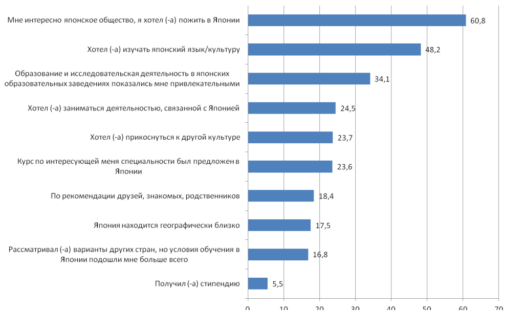
Рис. 4. Причины выбора иностранными студентами Японии как страны обучения, % ответов респондентов (по результатам социологического опроса JASSO, 2017 г.) 3

В-третьих, для некоторой части иностранных студентов привлекательны профессиональные планы: около 25% хотели бы заниматься деятельностью, связанной с Японией (рис. 4).