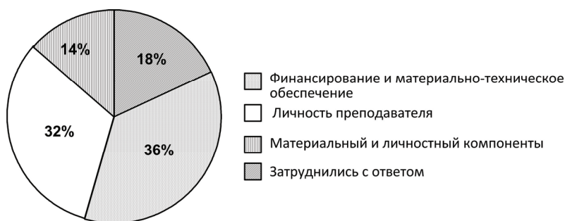
Рис. 3. Ответы респондентов на вопрос: «От чего зависит успешность внедрения цифрового образования?», %