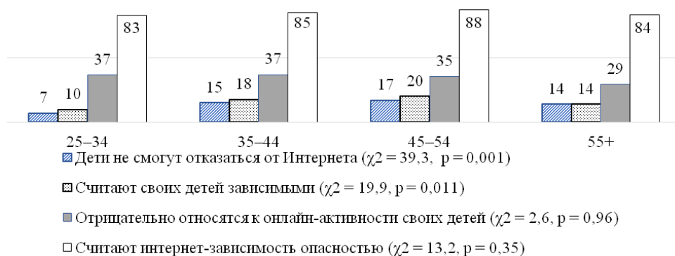
Рис. 2. Мнение родителей относительно интернет-поведения их детей, % от числа опрошенных родителей, \chi^2 Пирсона и оценки вероятности (p) отсутствия связи между соответствующим признаком и возрастом респондента

Мнение родителей о том, где у детей больше друзей – в реальной жизни или в Интернете, – показывает нам социальную компоненту эффектов онлайн-активности. В частности, 8% родителей считают, что у их детей больше друзей в виртуальной жизни, затруднились ответить на этот вопрос 14%. В то же время, по мнению 13% респондентов, их дети не сумеют отказаться от Интернета ни на один день, еще 23% ответили, что они смогли бы ограничить доступ детей к Сети не более чем на один день без риска конфликта с ними. Эта компонента статистически устойчиво и значимо различается поколения родителей и их детей. Указанный вывод также подтверждается оценками по критерию согласия Пирсона \chi^2 , коэффициент ранговой корреляции Спирмена равен 0,137** и 0,345** (рис. 2 и приложение). Указанные эффекты являются статистически устойчивыми, но не сильными.