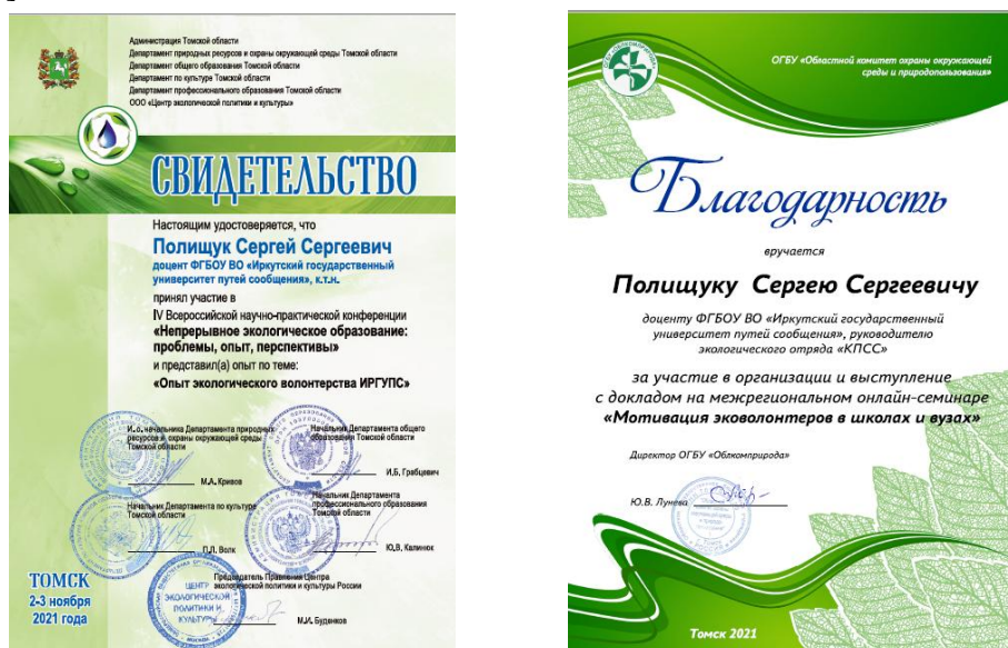
Рисунок 1 — Итоги выступлений в Томске за 2021 г.