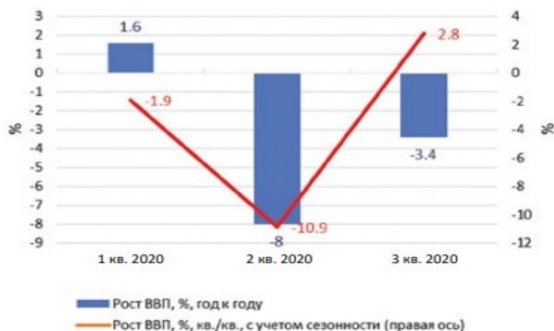
Рисунок 2 – Изменения ВВП с 1 по 3 квартал 2020 года