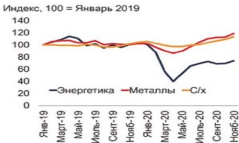
Рисунок 1 – Рост мировых цен

В третьем квартале 2020 года рост ВВП составил -3,4% в сравнении с этим же периодом прошлого года. Этому способствовало относительное оживление экономической активности, благодаря начавшемуся снижению количества случаев заражения коронавирусом, что вызвало уменьшение ограничений (Рисунок 2).