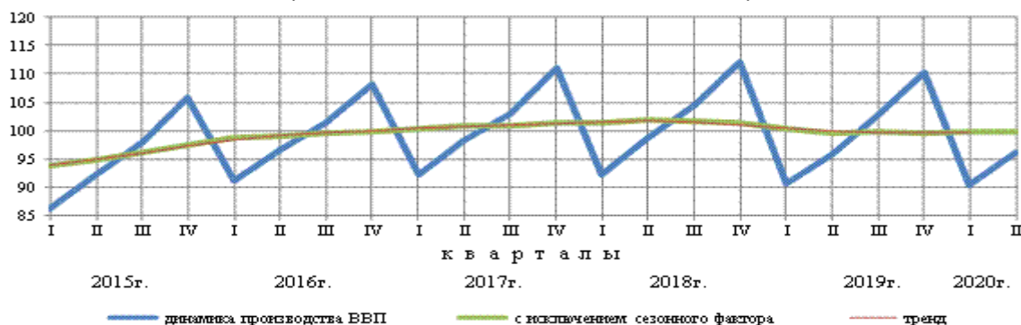
Динамика производства ВВП 1) в % к значению условного среднего квартала 2016 года (1/4 номинального значения ВВП за 2016 год)

1) Оценки данных с исключением сезонного и календарного факторов осуществлены с использованием программы "JDEMETRA". При поступлении новых данных статистических наблюдений динамика может быть уточнена.