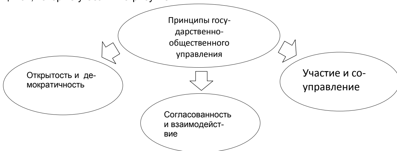
Рисунок 2 – Принципы государственно-общественного управления образованием

В результате анализа научной литературы по данной тематике было выявлено, что государственно-общественное управление строится на ряде определенных принципов, которые указаны на рисунке 2.