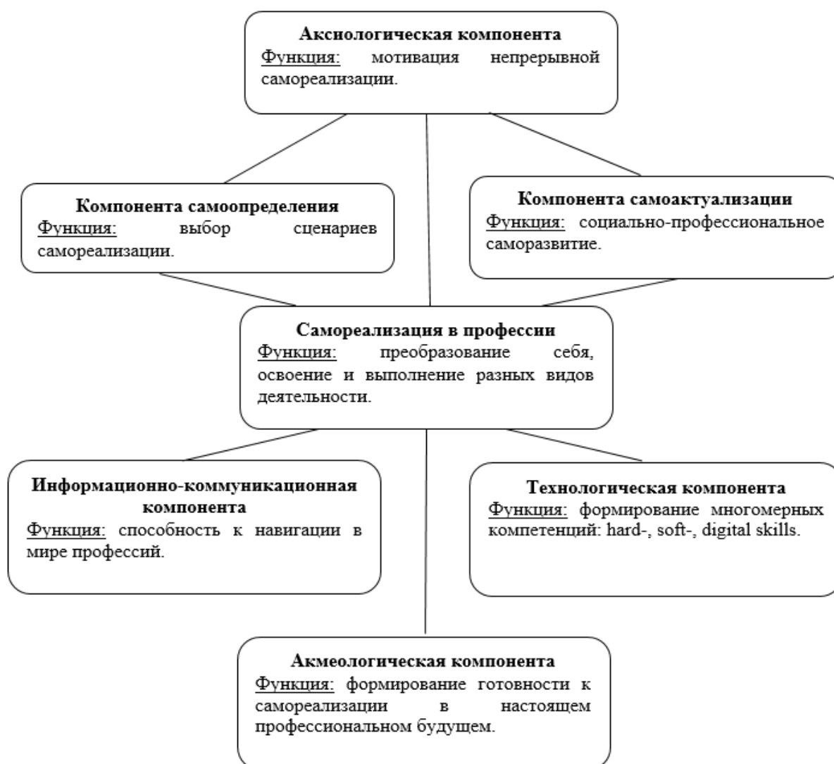
Рисунок 2 – Структурно-функциональная модель самореализации личности в образовательной и профессиональной деятельности

саморазвитию и самообразованию; профессиональная мобильность. Все эти качества личности реализуют акмеологическую составляющую самореализации.