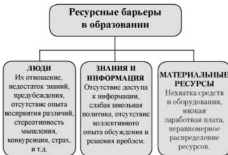
Рисунок 2– Основные проблемы организации инклюзивного образования

Эти определения дают интегративное понимание содержания инклюзивной образовательной среды на разных уровнях образования, в том числе и в СПО. В целом можно отметить следующие трудности в организации инклюзивного образования, которые представлены на рисунке 2.