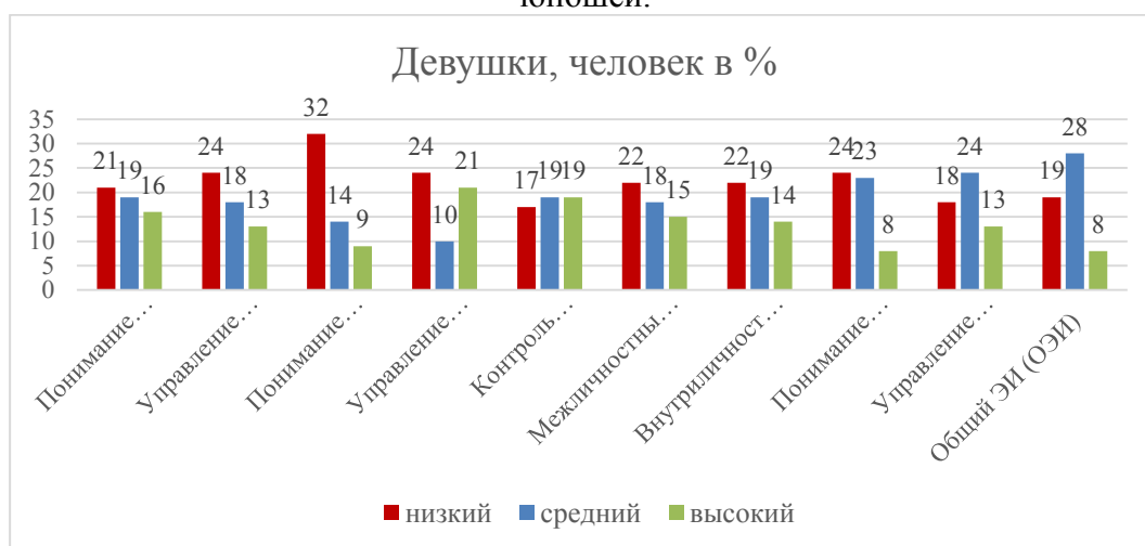
Рис. 3. Результаты исследования уровня эмоционального интеллекта «ЭМИн» (Д.В. Люсин) у девушек.

По результатам теоретического анализа выявлена высокая прикладная значимость эмоционального интеллекта в период подросткового возраста, когда идет активное формирование эмоциональной составляющей личности, повышенная потребность в коммуникациях, самоопределении.