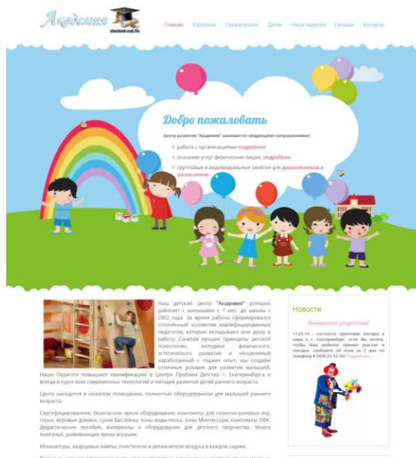
Рисунок 1— Главная страница сайта

На сайте компании будет размещена информация об организации, фото-галерея, модуль календаря предстоящих событий, информационный модуль, гостевая книга, возможность оставлять комментарии пользователей, модуль для заказа звонка, информационные разделы для клиентов центра.