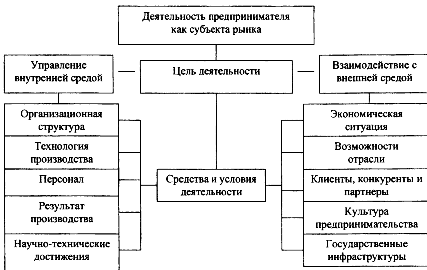
Рис. 1. Структура предпринимательской деятельности

Рассмотрение предпринимательской деятельности в теории и практике позволил Е.В. Беспамятных разделить ее на два направления: управление внутренней средой и организация взаимодействия во внешней рыночной среде (рис. 1). Под предпринимательской деятельностью она понимает особый вид экономической активности, которая основана на соединении всех факторов внешней среды и внутренних факторов организации производства в единый процесс 78 .