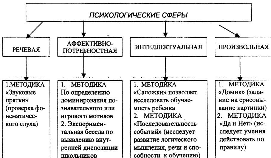
Таблица 2. Психологические сферы и методики их диагностики