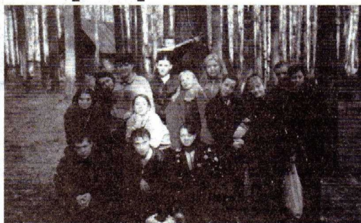
Наша группа ПД – 213 на турбазе «Шинник». 2001 г.

База представляла собой скопление цитовых домиков с минимальными удобствами. Условия были максимально приближены к боевым (туалета даже не было). Радовало одно, что мы здесь отдыхали «на халяву», благодаря одной девушке, у которой были знакомые на базе.