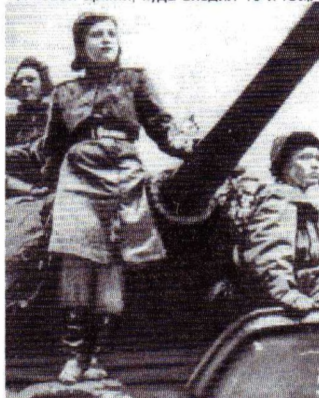
Уральцы в боевом строю

С самого начала операции возникли трудности. Почему? Противник оказывал ожесточенное сопротивление (его войсками командовал один из лучших немецких стратегов – генерал-фельдмаршал Манштейн). Весенняя распухца мешала продвижению танков и артиллерии, не хватало горючего и боеприпасов. В полосе наступления 4-й Танковой армии, куда входил 10-й гвар-