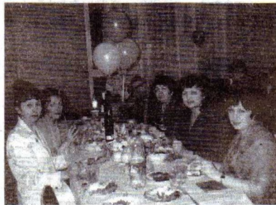
Новогодний бал начинается (кафедра Математики)

По просьбе сотрудников в этом году состоялась премьера новогоднего вечера-бала. Все было сделано с большой душой и – своими силами. Наша обычная столовая превратилась в сказочный дворец с сюрпризами и развлечениями. Замечательно приготовленные угощения дополняли праздничное настроение, и никакие мелочи не могли его омрачить, ведь праздник встречи Нового года в родной семье и родных стенах – большое счастье.