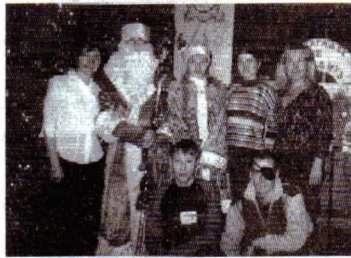
Организаторы детского праздника

Итак, ваши идеи, ваша активность – наша поддержка. Профком сотрудников