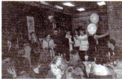
Выступление кафедры Иностранных языков на новогоднем балу