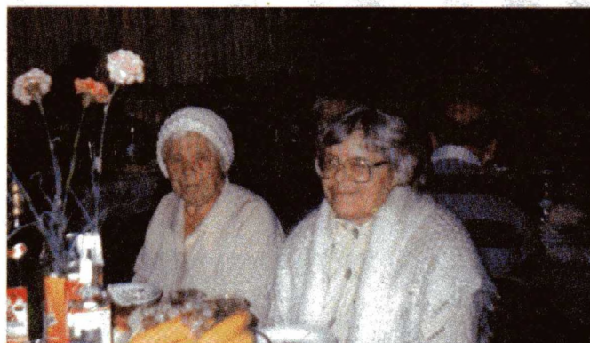
В «День пожилого человека» для многих ветеранов появилась редкая возможность посидеть за общим столом