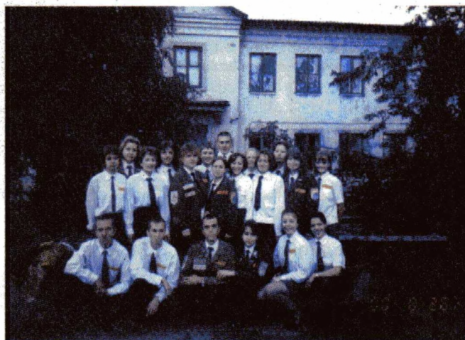
Студенческий отряд проводников «Фаворит»

там из ССО «Рифей» приходилось строить и ремонтировать самые разнообразные здания, начиная от склада и заканчивая часовней (часовню возводили в г. Югорске). Есть у нас и женский строительный отряд - «На-