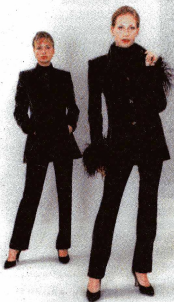
В этом учебном году Театр мод продолжит показ своих моделей

ка», смотры художественной самодеятельности, Татьянин день, новогодний праздник, игры КВН, так и нечто новое, о чем пойдет речь дальше. Продолжат работу творческие коллективы: шоу-балет «People stile», Театр мод, КВН-студия, которые хорошо представили себя на сцене в прошедшем сезоне. Ждем и продолжения музыкальных встреч с камерным симфоническим оркестром «ВАСН», коллектив которого полюбила и восторженно принимала университетская аудитория