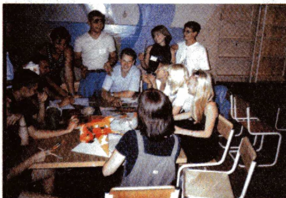
Первая встреча первокурсников в оздоровительном лагере «Мечта»

Житейская мудрость гласит: каков начин, таков и почин. В Социальном институте в очередной раз проверили эту истину. Под девизом «Соиновские пирожки» в начале сентября прошел учебно-методический сбор для тех, кто только появился в университете в почетном статусе студента. Как приятно, когда встреча с новыми людьми, условиями нелегкой, но веселой студенческой жизни проходит в атмосфере понимания, доброжелательности и с чувством юмора. В оздоровительном лагере «Мечта», что находится в живописных окрестностях города Ревды (места проведения трехдневных сборов), студенты-первокурсники имели возможность познакомиться друг с другом, а также с администрацией и преподавателями Социального института, которые, как оказалось, не такие уж строгие и суровые. У всех участников проекта чувствовалось стремление достичь вершин взаимопонимания. Символичным был и общий поход к вершине горы Волочиха, с которой открываются глазу удивительно бескрайние просторы неба и земли.