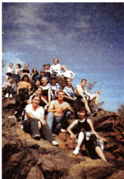
На вершине горы «Волочиха»