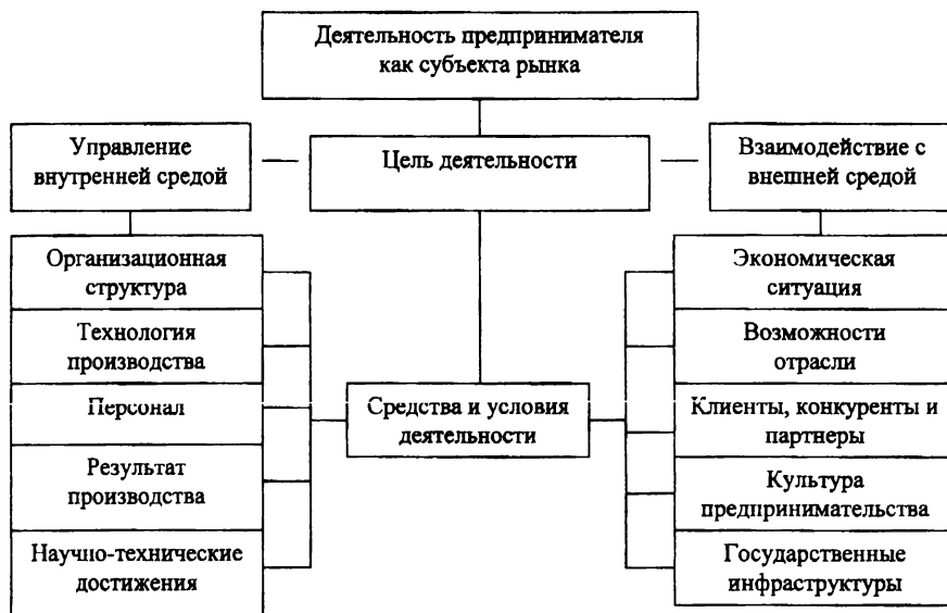
Рис. 1. Структура предпринимательской деятельности

среде (рис. 1). Под предпринимательской деятельностью она понимает особый вид экономической активности, которая основана на соединении всех факторов внешней среды и внутренних факторов организации производства в единый процесс[10].