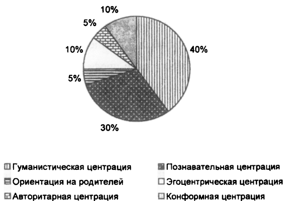
Рис.3. Диаграмма выраженности типов педагогической центрации

Результаты диагностики типа педагогической центрации отражены на рис. 3.