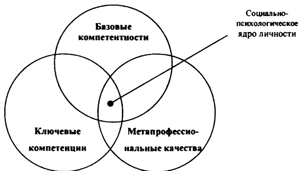
Рис. 2. Взаимосвязь профессионально-обусловленных конструктов ремесленника-предпринимателя

Мы рассмотрели ведущие конструкты личности ремесленника. В структуру каждого конструкта входят когнитивная (познавательная) и мотивационно-потребностная составляющая, которые обеспечивают их взаимодействие. Эти социально-психологические образования определяют вектор развития личности ремесленника-предпринимателя, выступает в качестве социально-психологического ядра. Схематически взаимодействие всех профессионально-обусловленных конструктов личности ремесленника представлено на рис. 2.