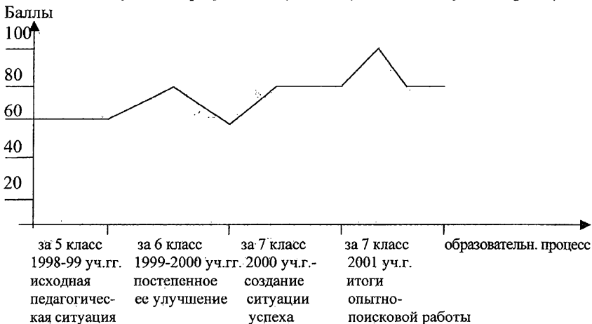
Рис.3. Динамика учебных результатов (в баллах) по годам обучения

После проведения итоговых годовых контрольных работ была прослежена динамика учебных результатов (в баллах) по годам обучения (рис.3).