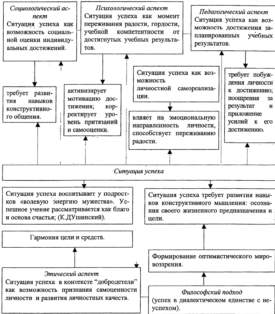
Рис.1 Междисциплинарное содержание понятия «ситуация успеха»

Ситуация успеха, на наш взгляд, – это целенаправленно создаваемая учителем ситуация, в которой ученик достигает запланированный учебный результат, оценивает его как успешный и переживает его как лично и социально значимое достижение.