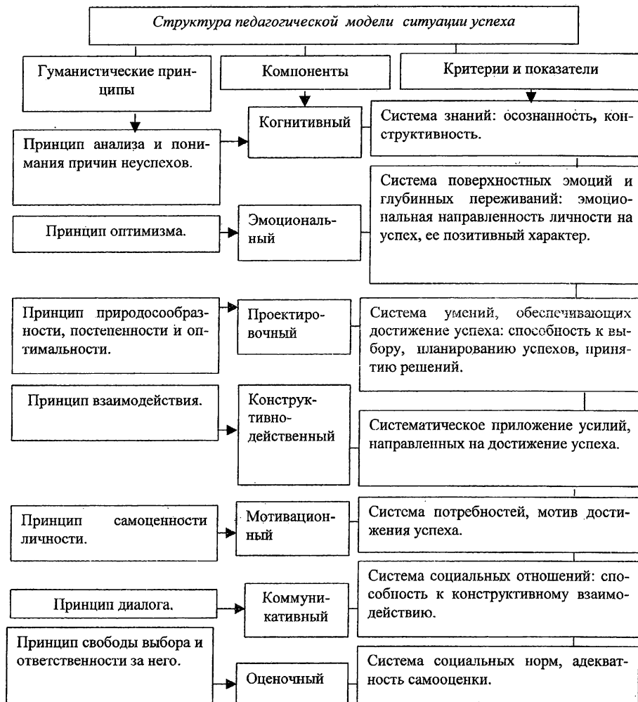
Рис. 2. Педагогическая модель ситуации успеха

Исходя из многоаспектной сущности ситуации успеха, нами построена ее педагогическая модель (рис. 2).