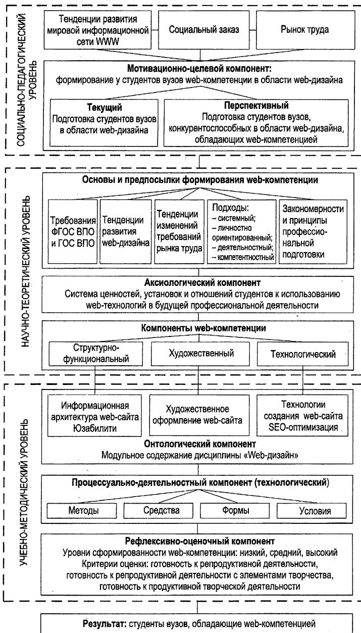
Рис. 4. Модель научно-методического обеспечения подготовки студентов вузов в области web-дизайна