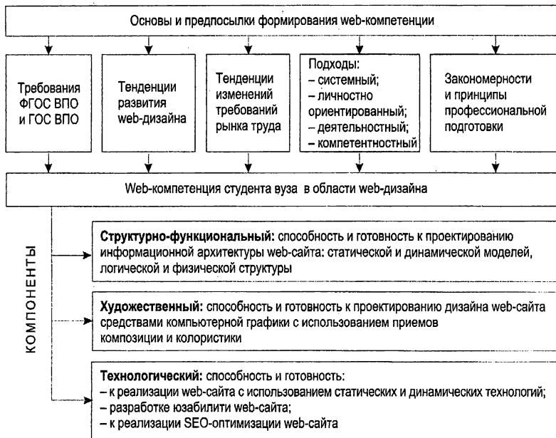
Рис. 2. Компонентный состав web-компетенции студента вуза в области web-дизайна

ленной нами web-компетенции, что, возможно, снижает качество подготовки студентов вузов в области web-дизайна; 2) существующие книги и интернет-источники, посвященные изучению web-дизайна, чаще всего неприемлемы для ведения процесса обучения, так как не в достаточной степени включают дидактический аспект; 3) преподаватель, ведущий обучение по дисциплине «Web-дизайн», должен как владеть знаниями в области web-технологий, так и иметь широкий спектр знаний по различным видам дизайна, владеть методикой преподавания основ дизайна и организации выполнения обучающимися учебных дизайн-проектов.