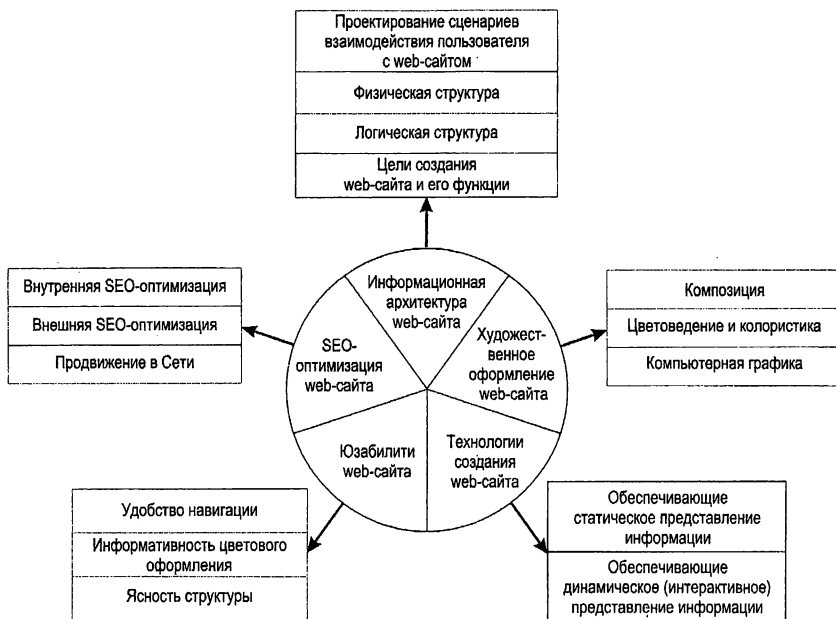
Рис. 1. Структура современного web-дизайна

Важное значение для удобства пользования сайтом потенциальными клиентами имеет юзабилити web-сайта. К оцениваемым качествам относятся время загрузки страниц, пути, по которым пользователи находят нужную информацию, оптимальность структуры ресурса, удобство оформления, навигации и др.