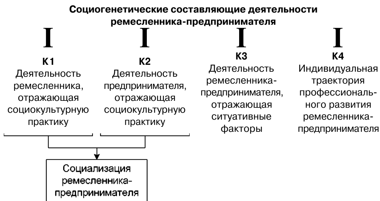
Рис. 1. Социогенетические составляющие деятельности ремесленника-предпринимателя

Смоделировать социогенетические процессы, чтобы проанализировать факторы, влияющие на ход социализации ремесленников-предпринимателей, позволят дидактическая многомерная технология и метод проектирования логико-смысловых моделей, разработанные В. Э. Штейнбергом [3]. Согласно концепции проектирования логико-смысловых моделей сформируем смысловые группы социогенетической структуры деятельности ремесленников-предпринимателей и определим их расстановку на модели (рис. 1).