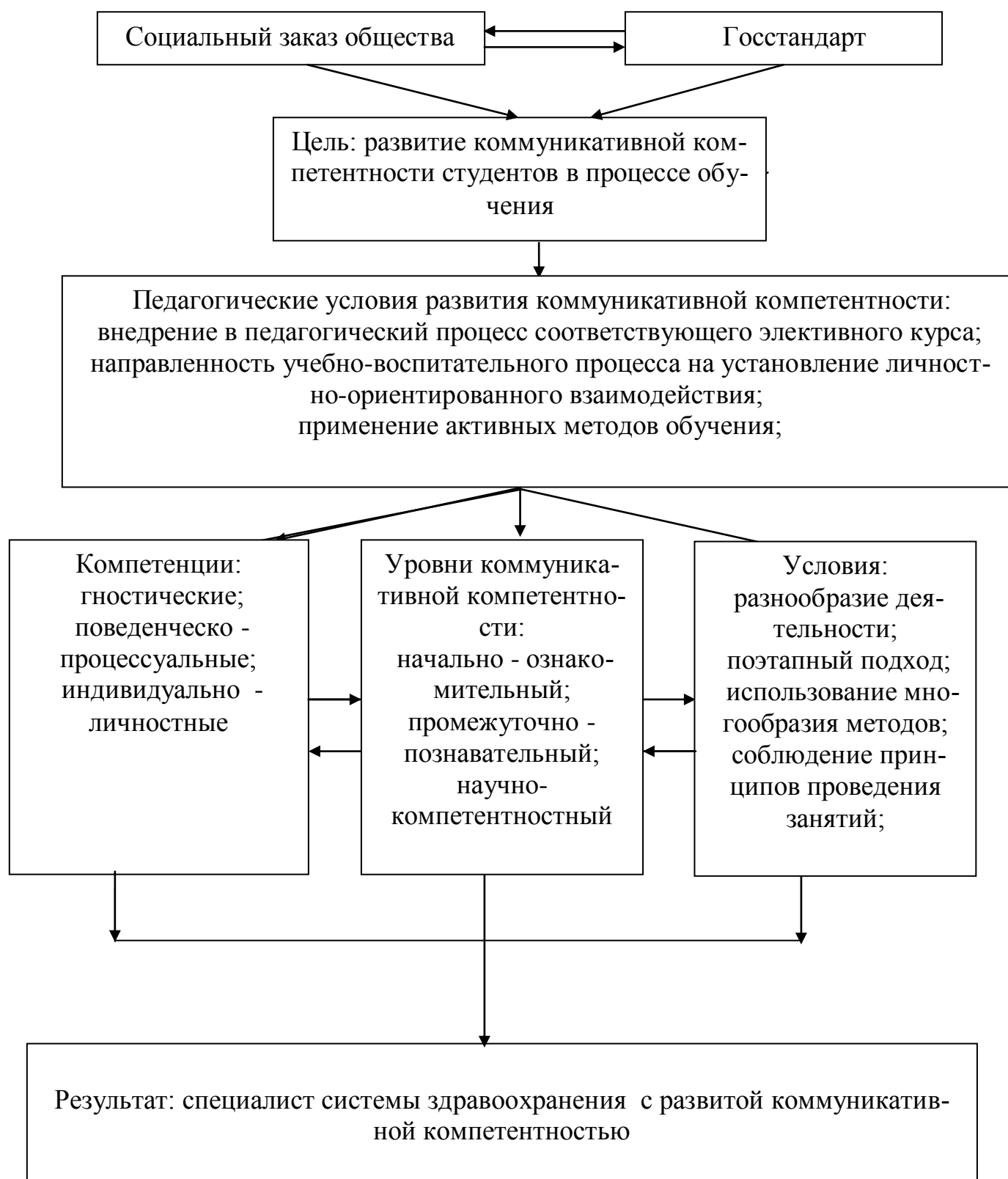
Рис. 1. Процессуально-содержательная модель развития коммуникативной компетентности студентов в процессе профессиональной подготовки

Во второй главе «Опытно-поисковая работа по развитию коммуникативной компетентности студентов медицинского университета» посвящена теоретическому и экспериментальному обоснованию педагогических условий, обеспечивающих эффективность развития коммуникативной компетентности