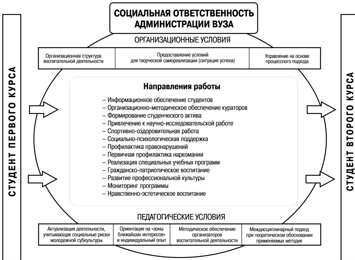
Рис. 2. Функционально-процессуальная модель адаптации студентов первого курса к образовательному процессу технического вуза